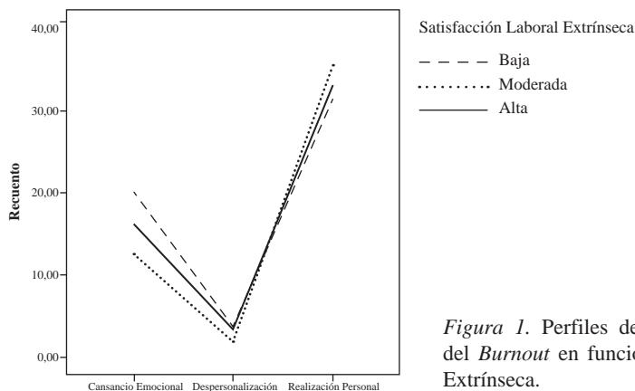
Figura 1. Perfiles de medias de las dimensiones del Burnout en función de la Satisfacción Laboral Extrínseca.

Mediante el análisis de comparaciones múltiples, con el método de Scheffé, se observaron diferencias significativas en el Cansancio Emocional entre los grupos de baja y moderada Satisfacción Extrínseca ( p = .000 ), y entre los grupos de baja y alta Satisfacción Extrínseca ( p = .000 ). Los docentes con baja ( M = 2.32 ; DE = 1.01 ) y moderada ( M = 1.60 ; DS = 0.88 ) Satisfacción Extrínseca obtuvieron promedios mayores de Cansancio Emocional en comparación con los docentes más satisfechos ( M = 1.32 ; DE = 0.69 ) (véase Figura 1).