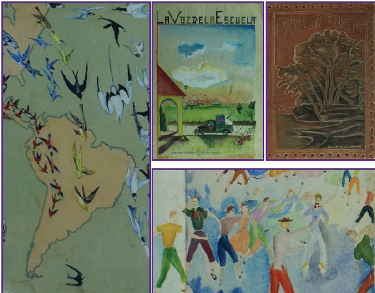
Figura 2. Portal Itinerarios Memoria y Experiencia Cossettini.