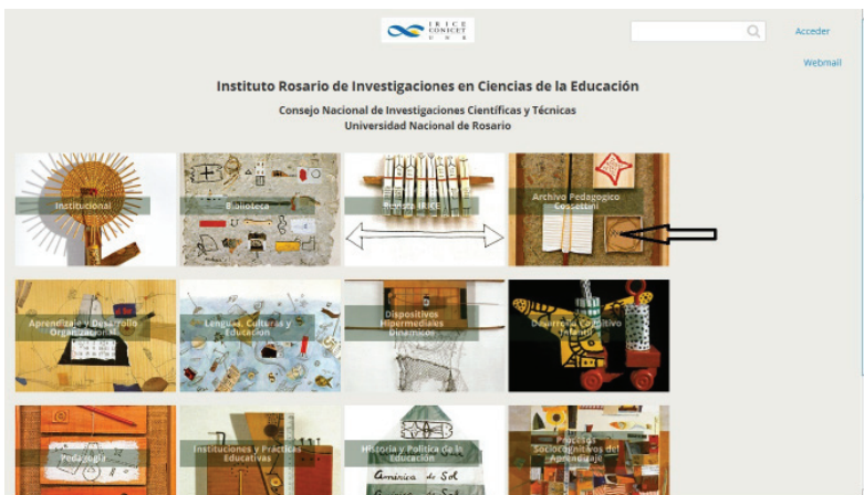
Figura 1. Portal IRICE ( http://www.irice-conicet.gov.ar )

mismo podemos acceder a información general, publicaciones en acceso abierto depositadas en el Repositorio Hipermedial de la UNR (comunidad IRICE), actividades académicas, entre otras cosas. De igual forma, se pueden explorar las distintas líneas y programas de investigación que desarrollamos en el instituto, la revista IRICE, noticias y videos institucionales. Cabe mencionar que este espacio web se ha configurado utilizando un entorno académico abierto (OAE, Open Academic Environment, APEREO), que posibilita el trabajo colaborativo y en red.