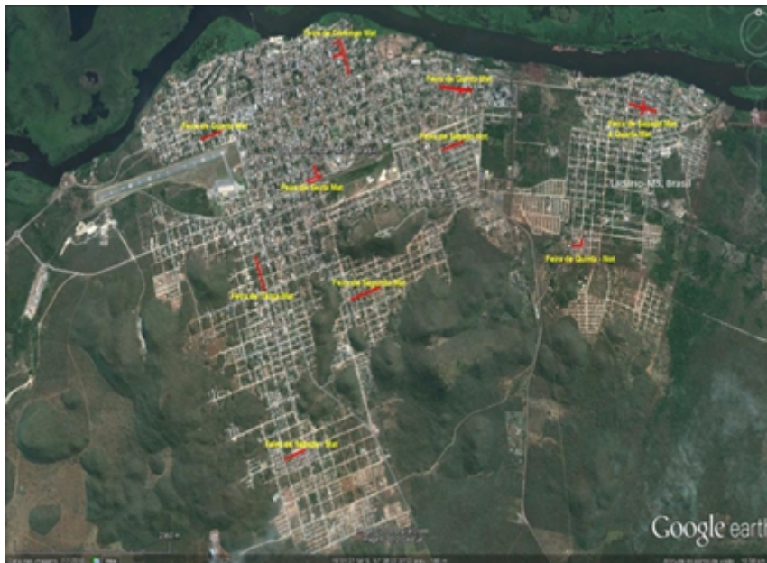
FIGURA 2 Localização das feiras livres nas cidades de Corumbá e Ladário