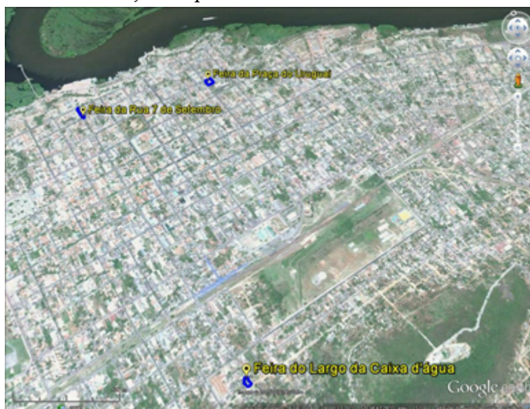
FIGURA 1 Localização das primeiras feiras livres de Corumbá

Fonte: Jornal A Tribuna (Edição nº 17.731 de 3/5/1960). Org. Espírito Santo, A. L. Google Earth. Image © 2016 DigitalGlobe.