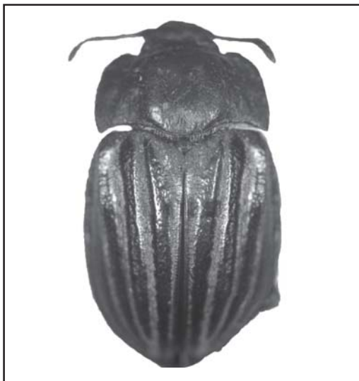
Fig. 1. Holotipo de Gyriosomus lineatus en vista dorsal.

Diferencias morfológicas. Geoborus lineatus tiene los élitros con surcos longitudinales provistos con pilosidad corta, amarilla o blanca, al igual que la mayoría de las especies de Gyriosomus (Flores, 1997). Sin embargo, ambos géneros poseen notables diferencias morfológicas, algunas de las cuales son de nivel tribal (Epitragini versus Nycteliini). Las especies de Gyriosomus se caracterizan por presentar glosa esclerotizada y visible en la zona ventral, la superficie del submentón es menor que la mitad de la superficie del mentón, el borde anterior del mentón cóncavo, proceso subgenal alejado del mismo, la inserción de los palpos labiales está expuesta, el borde lateral del pronoto es doble, separación procoxal igual que el ancho de una procoxa,