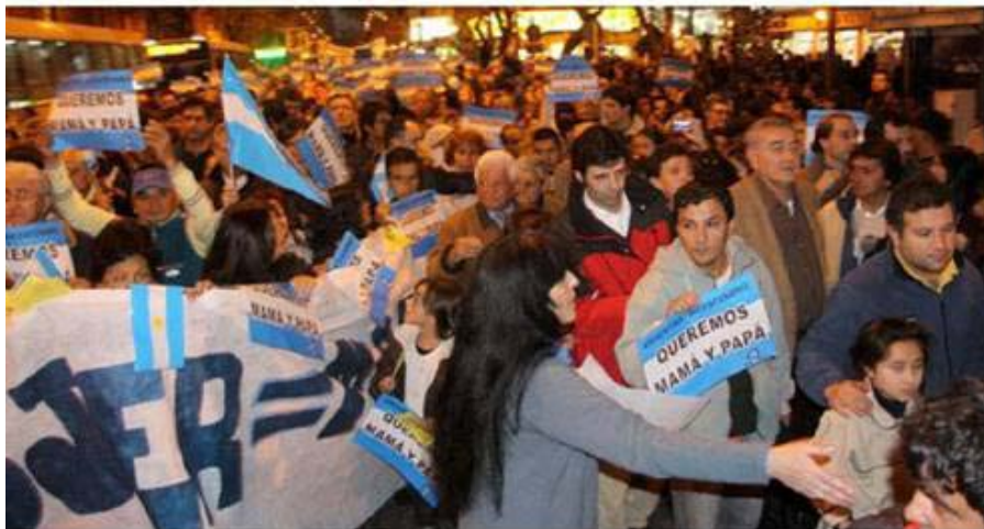
Fotografía publicada por el portal de Cadena 3, Córdoba, Argentina (19 de mayo de 2010) 22 .