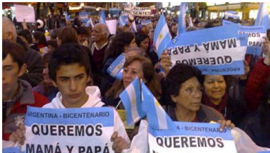
Fotografía publicada por el portal de La Voz del Interior, Córdoba, Argentina (19 de mayo de 2010) 23 .