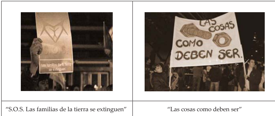
Fotografías publicadas en CBA Noticias (19 de mayo de 2010) 28