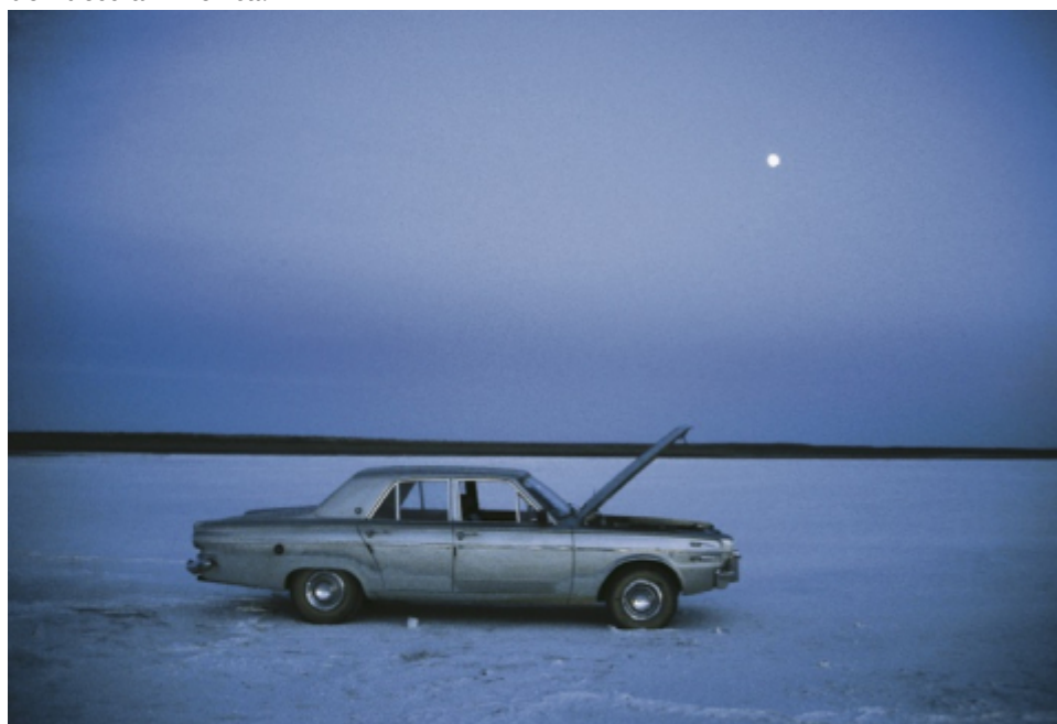
Invierno, mala vida , Gregorio Cramer, 1999