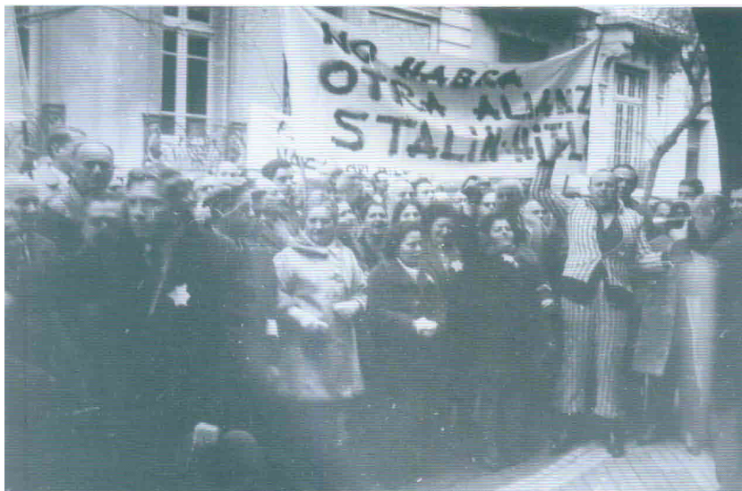
Ilustración 1: «Primera manifestación argentina frente a la Embajada de la URSS».

El uso de esta vestimenta cautivó a los cronistas quienes desconocían su origen- «Entre los manifestantes se destacaba notoriamente a un hombre adulto que sobre su traje de calle vestía un saco y pantalón a rayas blancas y negras que según nos informaron era el uniforme que los nazis obligaban a usar a los judíos en los campos de concentración» 38 - o se reían de ellos: «Uno de ellos [los manifestantes] vestía un uniforme similar a los que usaron los judíos en los campos de concentración de Alemania. Le iba muy ajustado. Ya habían pasado muchos años...!» 39 . La descripción de Crónica destacaba el mayor número de mujeres entre quienes se movilizaban. Algunas de ellas se quitaban sus abrigos y «mostraban sus brazos, en los que se podían ver números grabados en forma indeleble. También eran un recuerdo de los campos de concentración» 40 .