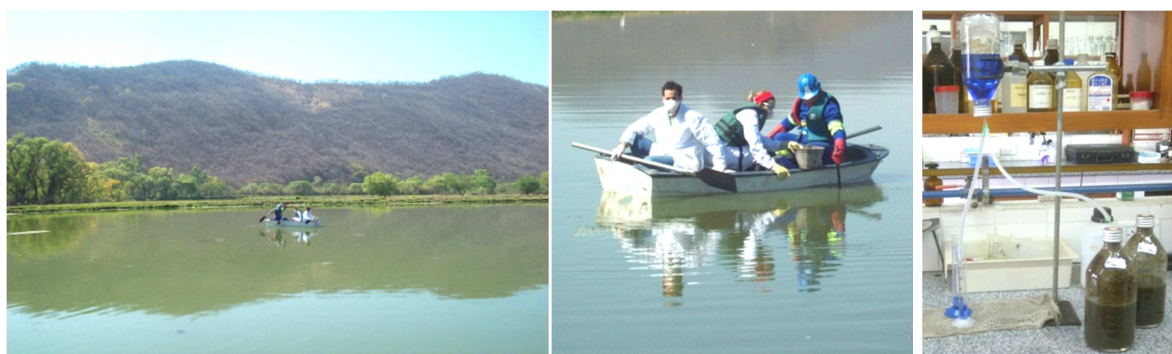
Figura 3. Izquierda y centro: toma de muestras de lodos en las lagunas de estabilización. Derecha: medición de gas metano por el sistema de desplazamiento de líquido.