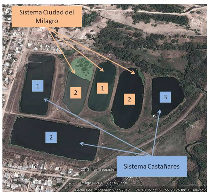
Figura 1. Ubicación de las lagunas de estabilización del sistema Castañares-Ciudad del Milagro. 1: Lagunas anaeróbicas; 2: Lagunas facultativas; 3: Lagunas de maduración.

Las LDE estudiadas en este trabajo se encuentran emplazadas en la zona Norte de la ciudad de Salta, cerca de la intersección de los ríos Vaqueros, Wierna y La Caldera, que luego forman el río Mojotoro. Estas lagunas fueron diseñadas para tratar los líquidos cloacales de los barrios Ciudad del Milagro, Universitario y Castañares (Da Silva Wilches, 2001; Liberal et al. , 1998; Arenas, 2010). El sistema puede ser dividido en dos sub-sistemas integrados por tres lagunas cada uno ( Figura 1 ). En el diseño original estaba previsto que cada sistema contenga una laguna anaeróbica, una facultativa y una de maduración. Por cuestiones operativas, la laguna de maduración del Sistema Ciudad del Milagro se opera como una segunda laguna facultativa (ver configuración de ambos sistemas en la Figura 1 ). El predio circundante a las LDE se encontraba totalmente deshabitado en un radio de aproximadamente 800 m al momento de su puesta en funcionamiento. Debido a la expansión demográfica que experimentó esta zona en los últimos años, y por problemas de planificación urbana, la planta de tratamiento fue rodeada por asentamientos poblacionales que se fueron consolidando paulatinamente. Los barrios más próximos a las lagunas son: Juan M. de Rosas (2918 habitantes), 17 de Octubre (3670 habitantes) y La Unión (2153 habitantes) (CoSAySa, 2012).