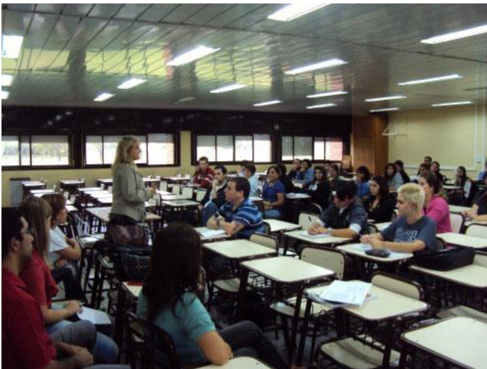
Imagen 5.

Los estudiantes valoran las relaciones que establecen con sus pares. La confianza , la ayuda , el acompañamiento , son algunas de las formas en que definen la importancia que tienen. Si bien reconocen la presencia de la universidad a través de diferentes instancias en las que sienten la ayuda para atravesar ese momento nada reemplaza los vínculos que generan por sus propios medios. Aceptando la situación de traspaso en la que se encuentran las relaciones que se valoran son aquellas que se establecen con las personas que se encuentran en la misma situación. De esta forma, la desorganización, desorientación, miedo o dudas son compartidos lo que define un espacio en el que dichas sensaciones son redefinidas y aceptadas en tanto forman parte de un entrenamiento colectivo y no problemas individuales. Quien no pueda formar parte de este tipo de espacios que define a las comunidades de práctica en la vida universitaria, más allá de lo que propone la institución, podría experimentar mayores dificultades para insertarse. En este sentido, los nuevos lazos afectivos que generan en este nuevo espacio son importantes porque tienden a disminuir la relevancia que los actores le brindan a los lazos de origen.