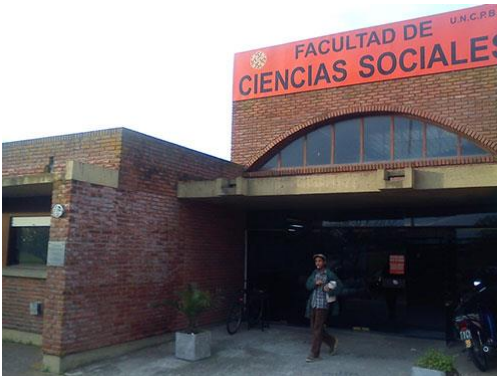
Imagen 3.

Las iniciativas impulsadas desde la Universidad y la Facultad reconocen la relevancia que tiene el momento de ingreso a la “vida universitaria”. Frente a ello, las acciones se orientan a vincular a los estudiantes al ámbito universitario a partir del conocimiento de las características del quehacer en la facultad y el mantenimiento de los lazos con sus familias en el marco de lo que define un momento de maduración. A continuación, se propone reflexionar sobre dichas iniciativas incorporando el análisis etnográfico realizado sobre la experiencia de traspaso que realizan los “ingresantes” inmigrantes. Esto, tiene dos implicancias. Por un lado, extender el abordaje más allá de las actividades que se realizan en la facultad entendiendo la “vida universitaria” como la totalidad cotidiana. Por el otro, reflexionar sobre las iniciativas establecidas desde la universidad haciendo hincapié en la documentación de lo no documentado . La importancia de este abordaje radica en comprender cómo otras dimensiones de la vida cotidiana se vinculan a la experiencia que realizan en la universidad y el CIVU, considerando que es la totalidad de la experiencia la que define la inserción.