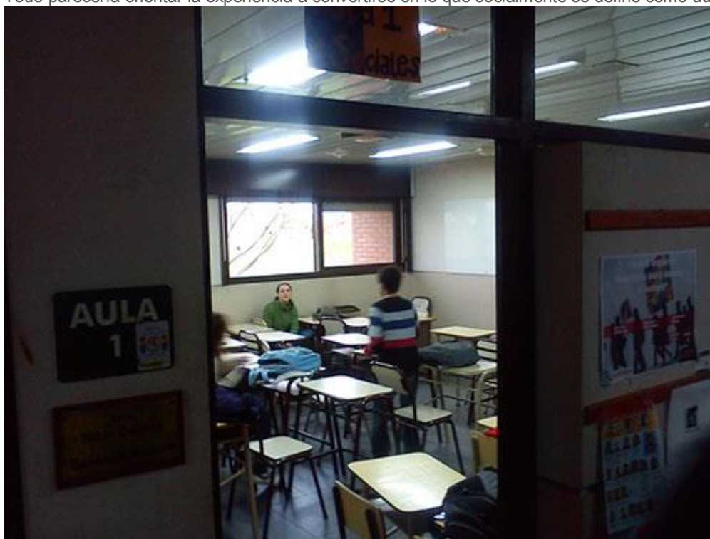
Imagen 4.

Así, la nueva etapa establece rupturas con el lugar origen a partir de los cambios que se establecen en el nuevo lugar de residencia. En primer lugar, los estudiantes se encuentran en la situación de vivir solos por primera vez proyectando esa situación a lo largo del año. La mayoría de ellos vivían con sus familias antes de llegar a la ciudad de Olavarría. Nunca habían estado mucho tiempo fuera de su hogar ni habían tenido la responsabilidad de estar a cargo de organizar sus actividades domésticas. En segundo lugar, la idea de responsabilidad se extiende al ámbito universitario en donde la delimitación que aparece con mayor claridad es la que separa la facultad de la escuela secundaria. De esta forma, los estudiantes participan en distintas actividades a partir de las que conocen las prácticas que definen ser un universitario. Todo esto lleva a constituir un entramado que va más allá del vínculo que establecen con la carrera que han decidido estudiar. Todo parecería orientar la experiencia a convertirse en lo que socialmente se define como adulto .