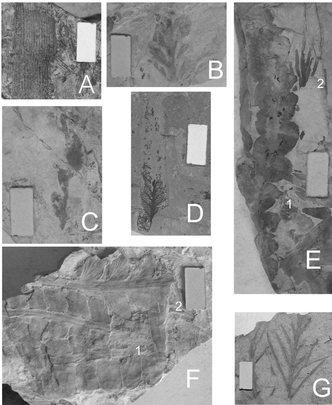
Figura 1. A, Neocalamites sp. BAFC-Pb 16270; B, Dicroidium incisum (Du Toit) Anderson y Anderson 1970 BAFC-Pb 16240; C, Dicroidium odontopteroides var. moltense Retallack 1977 BAFC-Pb 16185; D, Incertae sedis sp. A BAFC-Pb 16142; E.1, Dicroidium odontopteroides var. obtusifolium Johnston 1885, 2, Xylopteris densifolia (Du Toit) Frenguelli 1943 BAFC-Pb 16177; F.1, Zuberia zuberi (Szajnocha) Frenguelli 1943, 2, Dicroidium odontopteroides var. remotum (Szajnocha) Retallack en: Retallack et al. 1977 BAFC-Pb 16208; G, Xylopteris rigida (Dun) Jain y Delevoryas 1967 BAFC-Pb 16239c. Escala gráfica/ scale bar = 1 cm.

Xylopteris elongata (Carruthers) Frenguelli var. rigida (Dun) Bonetti, 1963, lám. 22, figs. 1-3, 5-6.