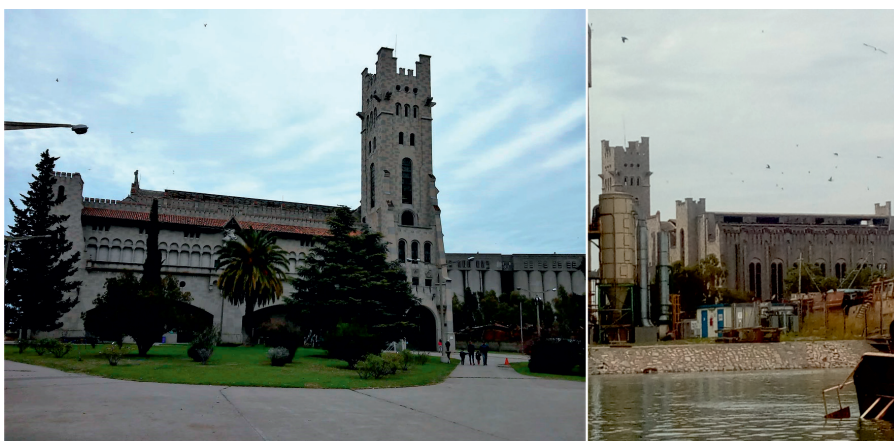
Figura 4. Ex Usina General San Martín, parte actual del complejo Museo-Taller Ferrowhite