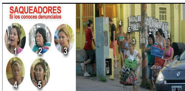
Figura No 4. Difusión saqueadores buscados.

Leonor Arfuch (2008) considera que el relato del crimen, en la exacerbación contemporánea, pone en escena no solamente el cuerpo de la víctima, resultado de una acción por naturaleza aberrante, no solo figura del asesino, en una dialéctica de fascinación y terror, sino en el propio acto del mirar; es decir, de algo que podríamos llamar: la monstruosidad del ojo . En la trama ficcional, el narrador realiza una descripción más ajustada de los hechos y utiliza una gran cantidad de detalles. El enunciador a la hora de contar un hecho le da ‘voz a otros reales’: testigos, amigos, vecinos. De esta manera los sucesos se empañan de opinión pública. Asimismo, la voluntad popular toma gran importancia y hasta genera una sensibilidad agudizada de quienes han estado próximos a la escena, la agresividad de ese ‘ojo por ojo’ que hasta el día de hoy aparece como reacción inmediata en nuestras sociedades.