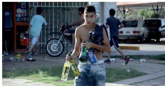
Figura No 3. Saqueos durante la mañana en Córdoba.

A partir de eso, comenzaron a generarse representaciones sociales, es decir, convenciones sobre objetos, personas o situaciones. Los actos de violencia física fueron comprensibles si se analiza el orden simbólico que generan las acciones y el universo imaginario dentro de un campo imaginario de relaciones sociales. Según Eliseo Verón (2010) todo lo que parece irracional, si uno lo pone en una trama de significados, se puede descifrar de otra manera y no hace falta ir a la intencionalidad subjetiva del actor. Lo simbólico se expresa en la relación de que se asocia una determinada apariencia con una determinada condición social. Esto no quiere decir que un símbolo signifique que alguna fotografía que se subió en las redes sociales representa algo en particular, sino que ‘leer’ esa fotografía se hace a través de una convención social .