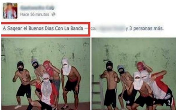
Figura No 1. Lanzan campaña en Taringa para identificar saqueadores de Córdoba.

Mediante el uso de las redes sociales, los saqueadores no solo anticipaban lo que ocurría en la calle, sino que buscaban el apoyo del colectivo para efectuar sus acciones. Utilizar Facebook les permitió poner en relación diversa información. A partir de esta herramienta de uso cotidiano fueron capaces de producir pánico y paranoia, haciendo que su uso sea también con el fin de convocar adeptos. En la primera captura de pantalla “A saquear el Buenos Días con la banda”, no solo se nombra el lugar donde se va a realizar el saqueo, sino que además se muestra qué un grupo de personas lo realizará. Fue una organización sobre un acontecimiento que se produjo de manera coordinada, y la tecnología facilitó esta comunicación para que otros se enteren que el saqueo se produciría en grupo.