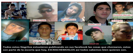
Figura No 7. Difusión saqueadores buscados.