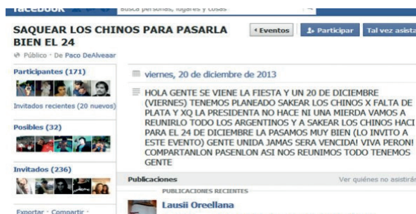
Figura No 2. Saquear los chinos para pasarla bien el 24.