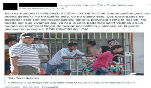
Figura No 5. Robos, saqueos y un total descontrol en Nueva Córdoba.

Para Judith Butler (2006), cuando se pone ‘al otro’ desde el lugar de lo negativo, se lo coloca en un espacio de vulnerabilidad lingüística que luego se convertirá en una vulnerabilidad física. Considera que en esta situación hay vidas que no gozan de un apoyo inmediato y furioso y no se califican como vidas que valgan la pena. Se excluye al ser humano, se lo considera nefasto y abyecto; es decir, se crea la figura de un enemigo, que se diferencia del buen ciudadano. Para la autora el espacio de violencia es un modo terrorífico de exponer el carácter originalmente vulnerable del hombre con respecto a otros seres humanos, un modo por el que nos entregamos sin control a la voluntad de otro.