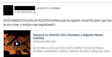
Figura No 8. La oportunidad y el saqueo.

desviados, los marginales), que no está determinado sólo por las condiciones socioeconómicas, sino también por la lectura que nosotros hagamos de ellos , y la que ellos hagan de sí mismos y de nosotros (Campo Tejedor, 2003). El individuo estigmatizado puede intentar corregir su condición de forma indirecta, y dedicar un enorme esfuerzo personal al manejo de áreas de actividad que por razones físicas o incidentales se consideran inaccesibles para el sujeto estigmatizado.