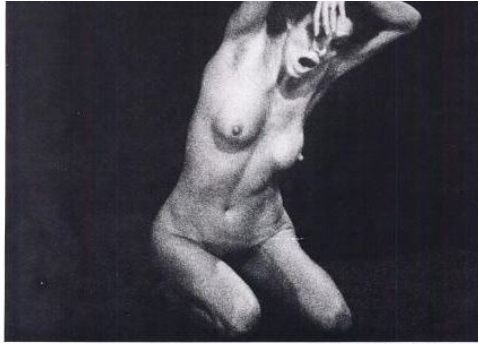
Ilustração III Foto: Edifício Alea. Leandro N. Alem e Viamonte. Buenos Aires, Buenos Aires (1968)

Ao considerar a fotografia como intersecção entre o verbo e a imagem, vale mencionar a carta enviada ao escritor cubano Roberto Fernández Retamar por Cortázar “Sobre a situação do intelectual latino-americano”, que foi originalmente publicada em 1967 na casa de revista das Américas. No segundo volume do Último Round , que inclui “a título de documento dado que por razones de gorilato mayor impiden que la revista citada llegue al público latinoamericano” (Cortázar 2009b, 265). O que é interessante é que na versão de UR se inclui reproduções fotográficas de esculturas pré-colombianas. É um lado latinoamericano que vem à luz nesta carta cuja posição política e horizonte ideológico são bastante acentuados.