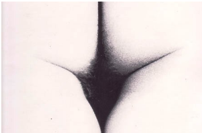
Ilustração V Foto: Frédéric Barzilay “Carta al viajero”. In Territórios (1969)

Incorporam-se fotografias de Frédéric Barzilay que se destacam por “ su manera de particularizar y segmentar el cuerpo humano, hacen que el escritor se convierta en viajero que se desplaza por un país nunca lo suficientemente conocido ”(Cisneros , 1978: 313); olhamos uma viagem através do corpo e se faz uma leitura de um artigo sobre o erotismo na literatura “ en donde el viaje se realiza a través del perfume y del silencio del tacto; el texto resultante es una exploración poética del cuerpo desnudo de una mujer ”(Cortázar, 2002, 38).