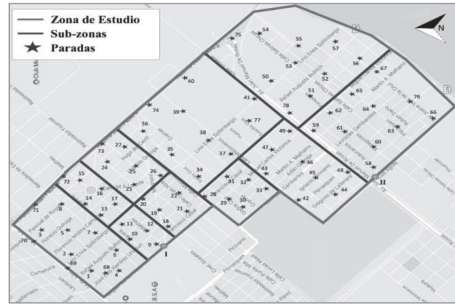
Fig. 2. Zona de Estudio. Identificación de Sub-Zonas y Paradas Establecidas.

El objetivo de este análisis es dual. Por un lado, se pretende que ambas empresas logren maximizar sus beneficios por los servicios prestados. Por otra parte, se desea generar una ruta mejorada para el pasajero, quien necesita un servicio ágil y