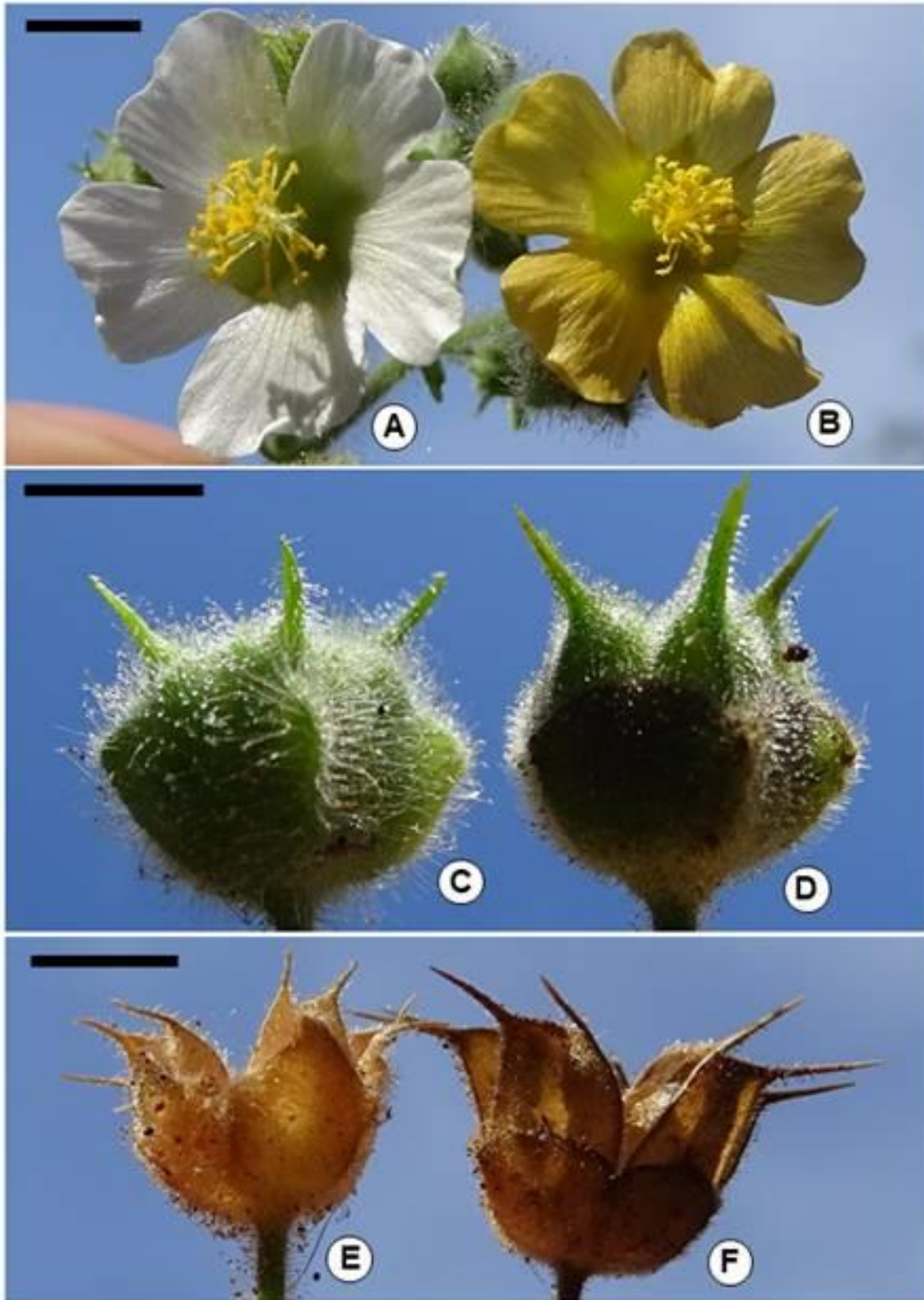
Figura 1. Pseudabutilon benense (izquierda): A: flor, C: fruto desarrollado; E: fruto abierto. Pseudabutilon balansae (derecha). B: flor; D: fruto desarrollado, F: fruto abierto. Escalas en mm, A y B: 5; C y D: 3; E y F: 4.