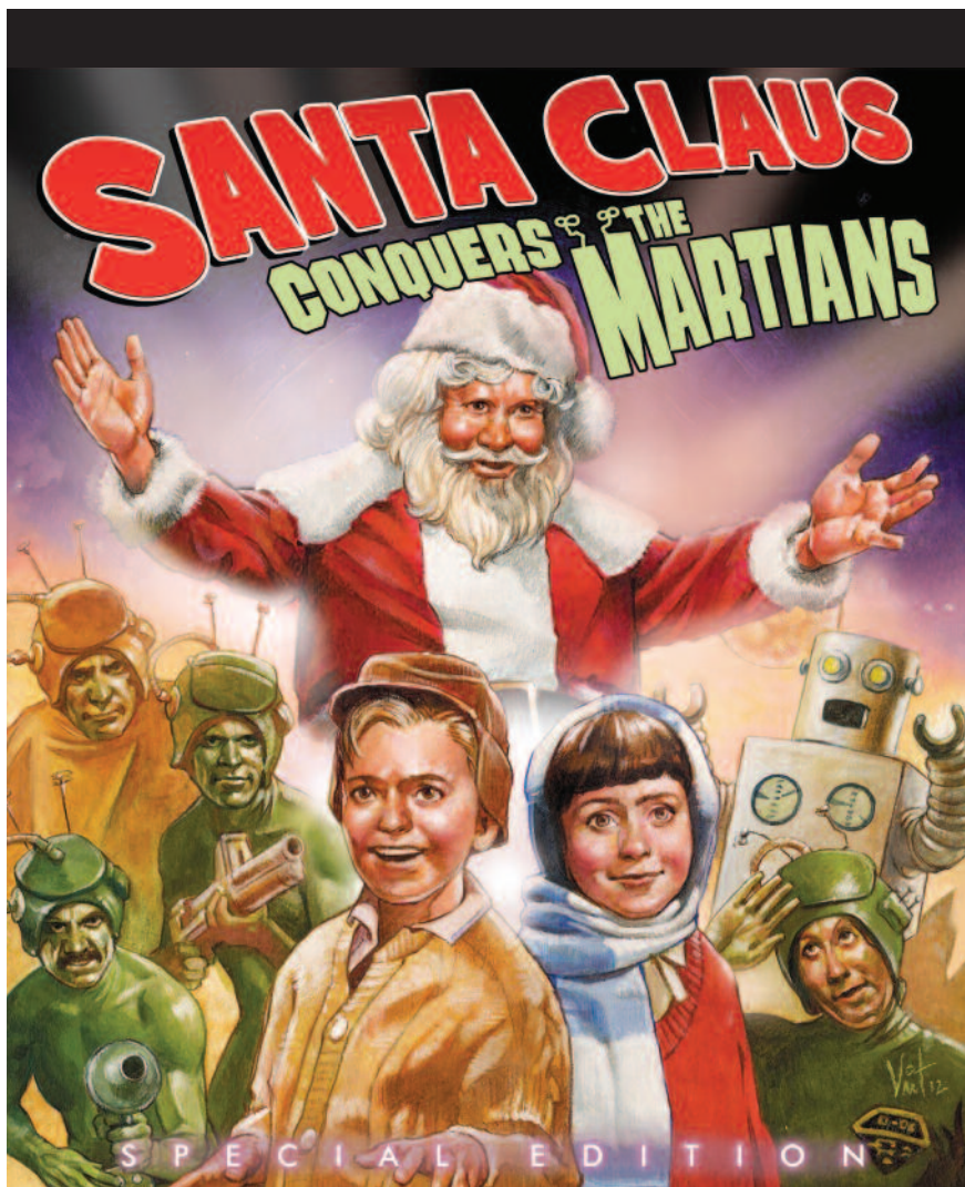
“Papá Noel conquista a los marcianos”, una de las tantas historias de ciencia ficción (y una de las más bizarras que encontramos) en las que los extraterrestres son antropomorfos.

¿Por qué la mayoría de los autores de ficción (en sintonía con su público) imaginan a los seres extraterrestres como criaturas humanoides? Muchas personas, frecuentemente estimuladas por sus respectivas cosmovisiones religiosas, creen que los humanos somos la especie superior y que nuestra existencia responde a alguna finalidad trascendente. Aún quienes aceptan que nuestra especie evolucionó a partir de algún primate no humano (una obviedad a estas alturas