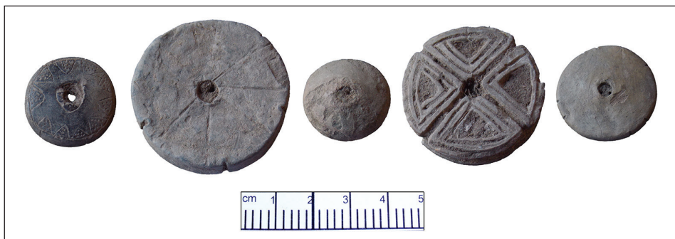
Figura 1. Conjunto de pesos de huso para hilado (“torteros”) asociados a fibras de algodón. Sitio Sequía Vieja (sector SV 150), Bañados de Añatuya, Santiago del Estero

En esta nota presentamos la metodología aplicada y los resultados obtenidos en relación con la recuperación e identificación de fibras asociadas a un conjunto instrumental empleado para la producción de hilados: “torteros” o muyunas (figura 1).