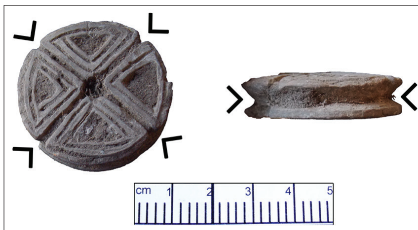
Figura 4. Vista frontal y sección de tortero N°4 con fibras asociadas al surco lateral del ejemplar. Las flechas indican la posición de ranuras transversales y surco perimetral al perfil del tortero

Ocho de los nueve artefactos fueron recuperados en la excavación de diversos sectores (piso, derrumbe y área postocupación habitacional) de un montículo de uso primariamente residencial; el noveno procede de recolección superficial en las inmediaciones bajas del mismo montículo. En principio, parte de ellos pueden asociarse al uso de dicha área como vivienda, habiendo quedado los torteros sobre el piso o mezclados con el material de derrumbe, otros pueden asociarse a la reutilización del mismo lugar como espacio de actividades, circulación