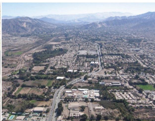
Procesos de planificación urbana participativa, Programa Quiero Mi Barrio, Copiapó, Chile (2015)