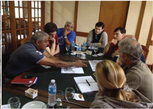
Barrio 20, Buenos Aires: proceso participativo de re-urbanización (2018)