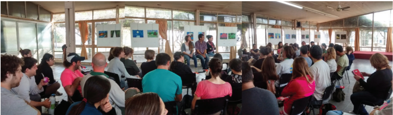
Proceso de planificación participativa. Rosario, Argentina 2014.

Key words: Strategic planning, Popular participation, City, Latin America.