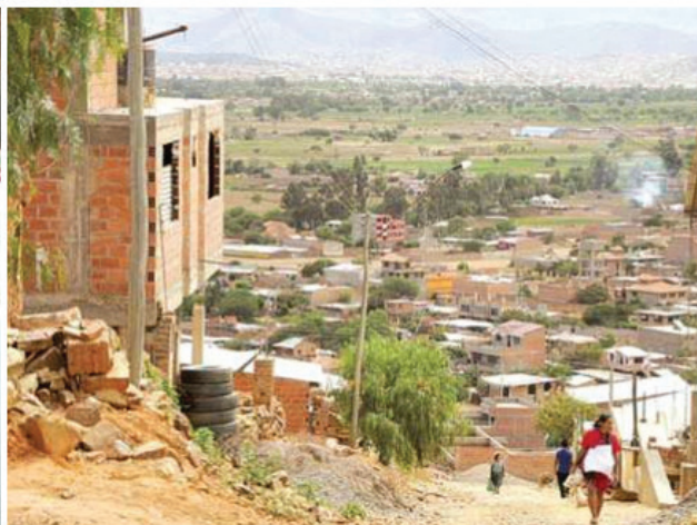
Distrito 9, municipio de Cercado, Cochabamba, Bolivia. Firma de acuerdo entre el gobernador y dirigentes de Juntas Vecinales y sindicatos de la zona; mejoramiento puente Tamborada – Cruce Villa Israel (2016).

programas de regularización de ocupación de los asentamientos de todo el país y vincula la oportunidad de mejores condiciones de habitabilidad con otras instituciones del Estado. Su trayectoria se inicia en ONGs, promoviendo procesos de participación en barriadas populares -poblaciones originarias, tecnologías apropiadas-. Su mirada alrededor de la participación en procesos de desarrollo urbano atraviesa los mismos claroscuros que la de sus colegas de toda la región: