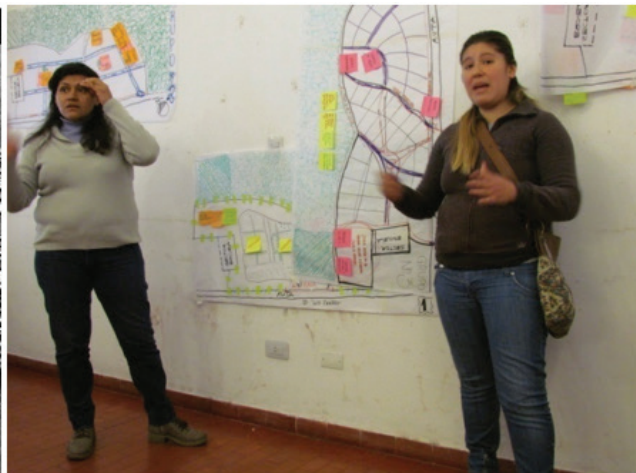
Villa Radieuse, modelo urbanístico de Le Corbusier (1924) Familias de Puesto Viejo, Jujuy, pensando junto al CEVE en el diseño urbano de su barrio (2015)