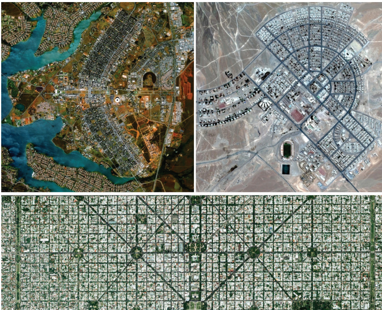
Brasilia (Brasil), El Salvador (Chile), La Plata (Argentina)