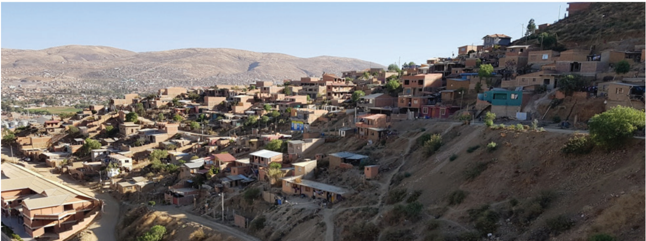
San Pablo (Brasil), Villa 20, Buenos Aires (Argentina), San Miguel (Cochabamba, Bolivia)

En esa lucha ¿libre? y desigual algunos pocos ‘ganadores’ disfrutan de zonas con servicios de calidad, infraestructura, equipamiento, viviendas confortables del siglo XXI. En esa lucha ¿libre? y desigual millones de ‘perdedores’ acceden -como pueden- a zonas ambientalmente degradadas, con servicios deficitarios o inexistentes, niveles de inseguridad creciente, equipamiento precario, accesibilidad limitada y condiciones habitacionales semejantes a los del siglo XIX. ¿Es posible ganar mientras la mayoría pierde?