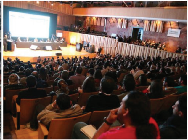
Reformas urbanas del siglo XX - Audiencias públicas del siglo XXI

titucionales es moneda corriente, es su lucha, su apuesta personal. Participar es tomar decisiones , nos dice con firmeza, nos alerta, y pone el acento en la tensión que ha atravesado la reconstrucción democrática durante los últimos años: ¿Democracia representativa o democracia participativa? 8