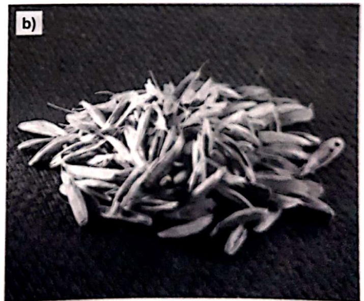
Figura 1. Lolium sp. a) planta en estado vegetativo, b) cariopse (fruto).