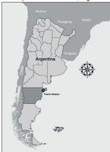
Figura 1. Localización de la ciudad de Puerto Madryn en la provincia de Chubut, Argentina

«La ciudad ventana al mundo» ubicada hacia el Este, sobre el litoral del Golfo Nuevo, incluye el centro comercial bancario y de servicios, viviendas residenciales, condominios, hoteles cinco estrellas y un polo científico. Se corresponde con los Distritos Centro y Sur. El primero comprende barrios como el Parry Madryn (Escuela Provincial N° 84), mientras que el segundo al Del Desembarco (Escuela Provincial N° 158).