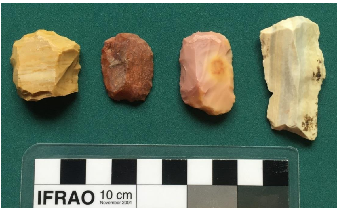
Figura 3. Algunos de los raspadores confeccionados sobre materia prima no local identificados en el sitio Alero 4.