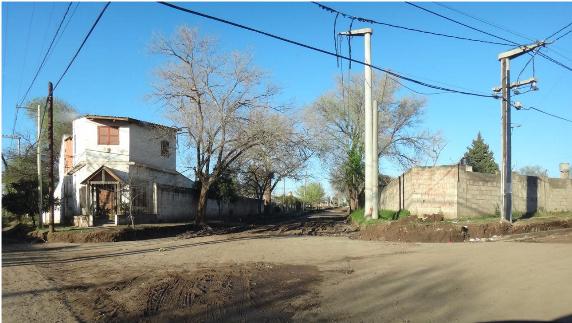
Foto 1 – Desde la plaza hacia la calle diagonal escenario de los hechos narrados