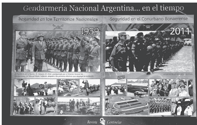
Fig. 2. Díptico conmemorativo del despliegue de la GN en la zona el Gran Buenos Aires, 2011.

En su número de mayo de 2011, la revista institucional de la GN 4 , Centinelas , trae un díptico desplegable que presenta en su lado izquierdo antiguas fotos en blanco y negro de gendarmes formados pasando revista ante el Presidente Ortiz, bajo la leyenda “1939, Seguridad en los Territorios Nacionales.” El lado derecho continua con imágenes en color, de unidades uniformadas en verde, y ricamente pertrechadas con rifles automáticos, carros de asalto, motos y terreno, ante la mirada de la actual Presidente Fernández, bajo la leyenda “2011, Seguridad en el Conurbano Bonaerense”. El díptico reconstruiría una trayectoria de 72 años donde la GN, creada en 1938 para pacificar los territorios de las fronteras norte y sur del país, incursiona desde 2000 en la lucha contra los bandidos en el territorio metropolitano del Gran Buenos Aires, históricamente en manos de la Policía Federal Argentina y la Policía de la Provincia de Buenos Aires.