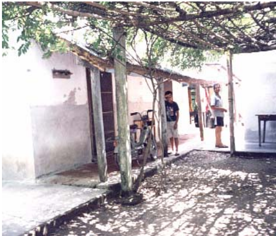
Figura 2. Vivienda en Balderrama, Tucumán

Además, las configuraciones espaciales se adecuan a las condicionantes climáticas: en Colalao del Valle, las viviendas de plantas compactas minimizar las pérdidas de la carga térmica ganada durante el día, durante los períodos fríos, mientras en Balderrama, los volúmenes aislados permiten la captación de vientos para favorecer el confort higrotérmico y el enfriamiento estructural de las construcciones en la época estival.