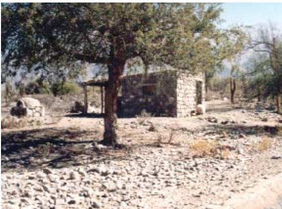
Figura 4. Vivienda en Colalao del Valle