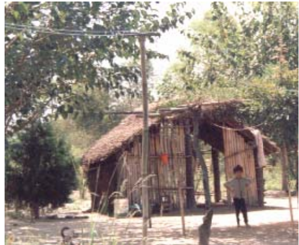
Figura 3. Vivienda en Balderrama