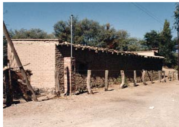
Figura 5. Vivienda en Colalao del Valle

Por otro lado, existen testimonios de 'arquitectura natural' que perduran desde hace años, siglos o milenios, demostrando que bajo ciertas condiciones pueden conservarse y seguir siendo útiles, pues estas construcciones pueden verse afectadas por elementos del ambiente que requieren ser tomados en cuenta, tales como: radiación solar, humedad, viento y animales, entre otros. La intensidad de estos factores varía según las condiciones climáticas y morfológicas de su ubicación geográfica.