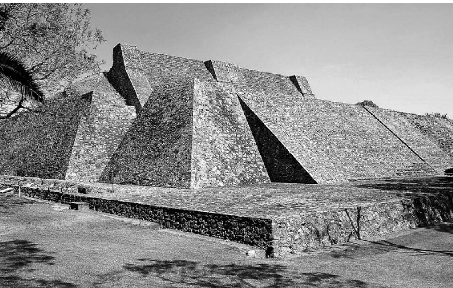
FIGURA 3. TENAYUCA. Sistema de escalinatas reconstruidas superpuestas con paso interior, los cambios coinciden con la salida de Gamio de su cargo.