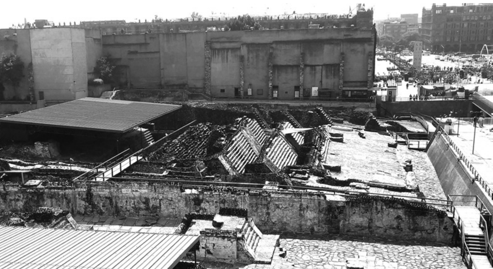
FIGURA 4. TEMPLO MAYOR. Vista actual reforzando la mirada frontal, simétrica, superpuesta de escalinatas y por suerte consolidando las intervenciones anteriores: el resultado es, como pedía Viollet-le-Duc: “llevarlo a un estado que pudo no haber existido nunca”.

En lo que sí podríamos coincidir con Viollet-le-Duc es en la imagen que estos sitios dejan al visitante: “Restaurar un edificio no es mantenerlo, ni repararlo, ni rehacerlo, es restablecerlo en un estado completo que pudo no haber existido nunca ”. Y así como los vemos no existió jamás, eso es cierto.