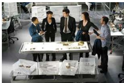
Figura 1. Las series televisivas donde aparecen detectives, médicos o forenses (como Bones , en la foto) proporcionarían un contexto potente para aprender (por analogía) sobre la naturaleza del pensamiento científico.

no, las pistas que proporcionará a lo largo del relato. En cambio, a la reconstrucción del crimen que hace el detective Hercule Poirot podría corresponder un método «analógico-abductivo»: él abduce la identidad del asesino a partir de las pistas que recogió y seleccionó.