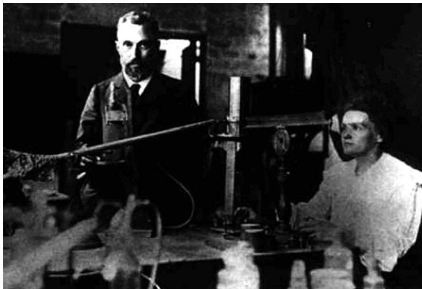
Figura 3. El electrómetro de cuarzo piezoeléctrico montado por los hermanos Curie ayudó a determinar que «la propiedad de emitir rayos que vuelven conductor el aire y que actúan sobre las placas fotográficas es una propiedad específica del uranio y del torio que aparece en todos los compuestos de esos metales, y que se debilita conforme la proporción del metal activo en el compuesto disminuye» (Curie y Curie, 1898: 176; traducción del autor de este artículo).

La unidad pretende modelizar una visión «contextualista» de la ciencia, que tiene en cuenta los factores internos y externos que se juegan en el momento de la elección entre modelos teóricos. En la película Les palmes de Monsieur Schutz se destaca el principal factor interno del episodio: el cambio de enfoque del problema de la radiactividad, que pasa a ser vista como un fenómeno físico, ligado a algunos elementos químicos a nivel de su estructura más íntima (fig. 3). Algunos factores externos, o «no epistémicos», contextualizan este cambio de enfoque: la disponibilidad de un nuevo instrumento, el electrómetro Curie (tecnología); la competencia entre dos laboratorios (financiación, distinciones), y la necesidad de explicar a los legos (por ejemplo, a la niñera Georgette) el problema teórico (comunicación).