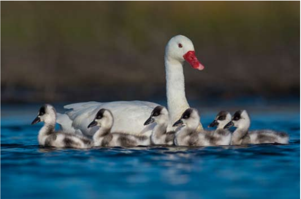
S/T, fotografía. Gabriel Rojo

La información empírica proviene de la revisión de documentos (Curriculum vitae y