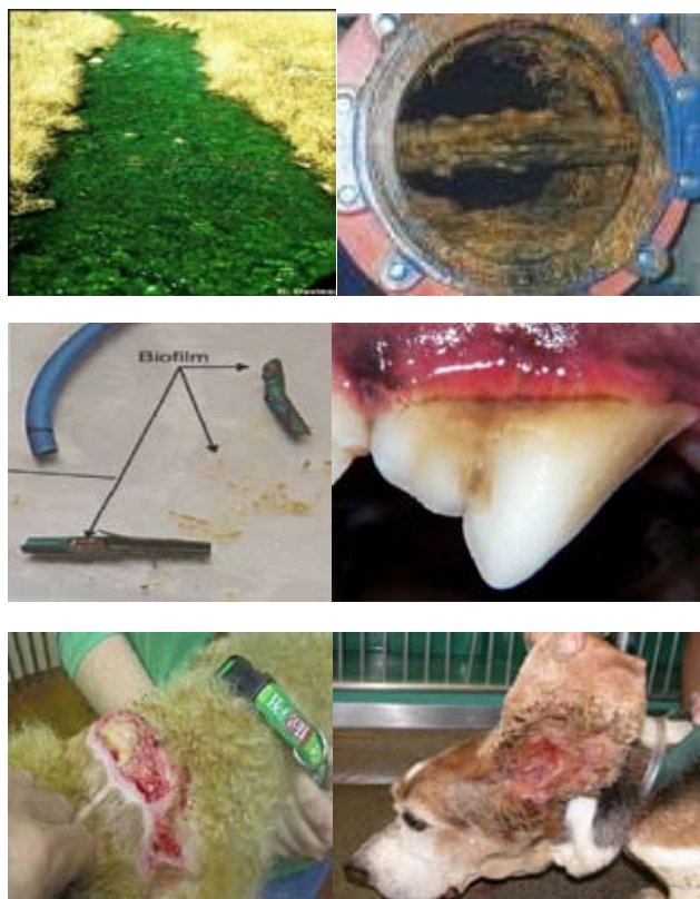
Figura 1. Ejemplos de biofilms. (A) en ríos; (B) en drenajes; (C) en catéteres; (D) en dientes; (E) en herida de piel; (F) en un caso de otitis externa.

La fase de adhesión se ha dividido posteriormente en una etapa reversible y una irreversible en reconocimiento a que la adhesión a la superficie inicialmente es débil. En esta etapa se produce la activación de mecanismos específicos que permiten la transición celular a una asociación con la superficie de muy alta estabilidad. La formación de agrupaciones celulares discretas se conoce como formación de microcolonias, lo que puede suceder ya sea por crecimiento clonal de las células adheridas o por translocación activa a través de la superficie. Las microcolonias crecen en tamaño y coalescen para formar las macrocolonias. La macrocolonia típica consiste de torres semejantes a hongos separadas por espacios llenos de líquido. Sin embargo, también son posibles estructuras alternativas como por ejemplo, estructuras planas. Las células, dentro de la