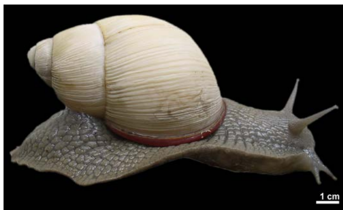
Figura 1. Ejemplar de Megalobulimus lorentzianus procedente de la zona de Mar Chiquita, Córdoba, Argentina. Vista lateral.

Para Bequaert (1948) y Leme (1973), Megalobulimus es un grupo de especies estrechamente relacionadas con caracteres similares, y la distribución de cada una de sus especies debe ser objeto de investigación para aportar al entendimiento de sus relaciones y sistemática. Por lo antes expuesto, en esta nota se compilan los registros de presencia de M. lorentzianus y se presentan por primera vez mapas de su distribución histórica, así como de su área de distribución potencial predicha a partir de un modelo bioclimático.