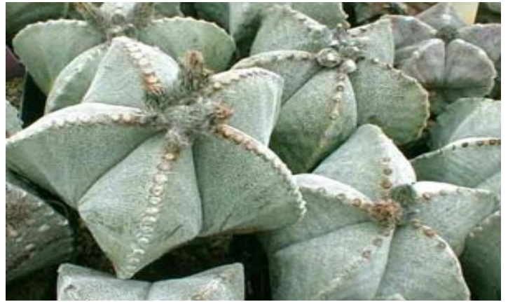
Ejemplares del género Astrophytum , grupo usado en la creación de híbridos con valor ornamental.

También las acciones de salvataje son difíciles y muchas veces se niega la autorización porque podrían ser una forma encubierta de extracción, una pantalla. Mientras escribo esto me llega la noticia que se está ampliando un camino, por una zona en la que se encuentran muchos ejemplares de Puna clavarioides (Pfeiff.) R. Kiesling y Pterocactus reticulatus Kiesling, endemismos de ciertos valles de altura en Mendoza y San Juan. Mi impulso