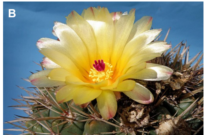
(A) Ejemplar de Gymnocalycium quehlianum (Fuente: http://picasaweb.google.com/lh/photo/Y_kviPpD_MFYIB9F_vXK-A ) y (B) ejemplar de Parodia submamulosa (Fuente: http://flickr.com/photos/23630893@N08/3028074684/ ).

Como la agricultura obviamente no puede impedirse, se debe fomentar la investigación para aumentar la eficiencia, de modo de producir más alimentos sin expandir aun más las fronteras agrícolas. Por otro lado, la creación de reservas naturales en todo tipo de ambientes, sean nacionales, provinciales, municipales o privadas; de distintos tamaños y con distintos fines (protección absoluta, o explotación limitada y controlada, reservas con fines didácticos...), es la complementación necesaria para proteger no solo las especies, sino las comunidades; y no solo a los cactus o suculentas, sino a todas las especies.