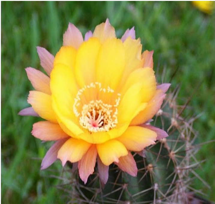
Lobivia walteri , especie removida con frecuencia de su habitat al efectuar limpieza de vías, pero multiplicada en viveros comerciales.

esta modalidad de extracción, lo que deseo es que no se exagere el perjuicio que causa y dedicar la mayor atención a otros factores perjudiciales de escala mucho mayor.