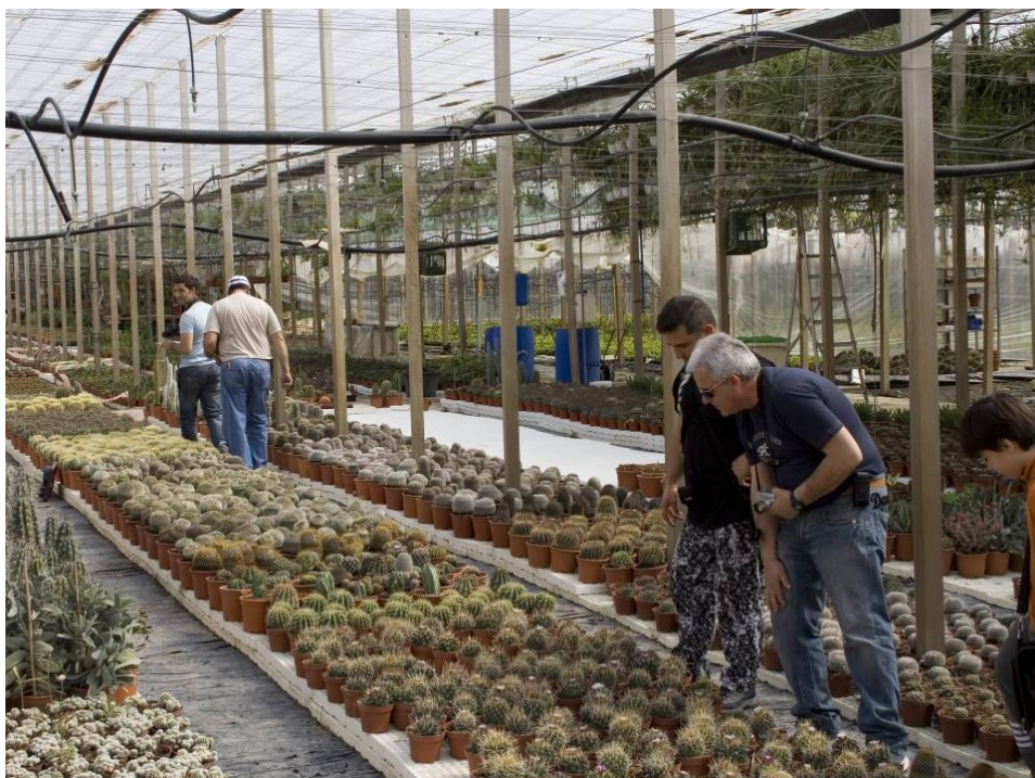
Visita de aficionados a un vivero de plantas suculentas.

Los cactus, la familia Cactaceae, exclusiva de América, está íntegramente incluida en los Apéndices del CITES, la Convención Internacional acerca del tráfico de especies amenazadas, como así también otras muchas plantas suculentas de uso ornamental. Desde diversos países y entre los argumentos de numerosos proyectos de investigación se clama y reclama que están en peligro. Sin embargo, los estudios sobre la dinámica de las poblaciones, en muchos casos demuestran que muchos cactus se comportan como malezas,