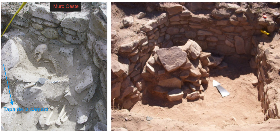
Figura 8. Sepultura 5. Izquierda: imagen de los restos articulados de la mujer. Fotografía tomada desde el Este. Derecha: aspecto de la cámara mortuoria una vez despejada la cobertura del sepulcro. Imagen tomada desde el Sur

El acompañamiento mortuorio de esta mujer tan sólo estaba compuesto por un trozo de pigmento rojo. Una vez retirado el conjunto de piedras que conformaban y demarcaban el sepulcro, en el siguiente nivel se detectó una pequeña lente de cenizas, carbones sueltos, huesos de camélido quemados y un pozo de escasa profundidad. Durante la excavación de este pozo se extrajeron restos de maderas; entre ellos se identificaron fragmentos del mango de una cuchara, y un tubo confeccionado sobre hueso de ave. El hallazgo de este tubo de hueso, como inclusión mortuoria (posiblemente se trata de un inhalador), resulta excepcional, ya que tradicionalmente el consumo de alucinógenos estaría mayormente relacionado con los hombres (Bordach 2006). Sin embargo, existen en el ámbito andino casos de individuos de características similares al de la Sepultura 5 (sexo femenino y de edad madura), inhumados junto a elementos propios del complejo de alucinógenos (tubos de inhalación y tabletas) (Llagostera, Torres y Costa 1988; Torres et al. 1991).