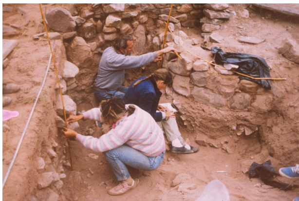
Figura 4. Fotografía de los trabajos de excavación y del relevamiento altiplanimétrico del patio central, Recinto 3.1, y del osario

El osario constituye claramente un rasgo positivo con contorno en forma circular de 1,6 m de radio y 1,5 m de altura original estimada. Para su construcción se levantó un muro curvo de piedra adosado al ángulo NE de las paredes perimetrales norte y este del patio central, las cuales, por sus características constructivas, debieron además funcionar como muros de contención del relieve en plano inclinado del nivel aterrazado superior (ver la figura 4). Se trata de una construcción especialmente levantada por sobre el piso de ocupación de este patio, con la finalidad de ser empleada para alojar secundariamente múltiples entierros, hecho posiblemente originado por la necesidad de relocalizar restos procedentes de la remoción de inhumaciones primarias, encontradas durante el remodelado de espacios habitacionales previos. Los cálculos del Número Mínimo de Individuos (NMI) permitieron identificar la presencia de un total de 21 individuos (11 adultos y 10 inmaduros, todos estos menores de cuatro años de edad) en su interior (Adaro 2002).