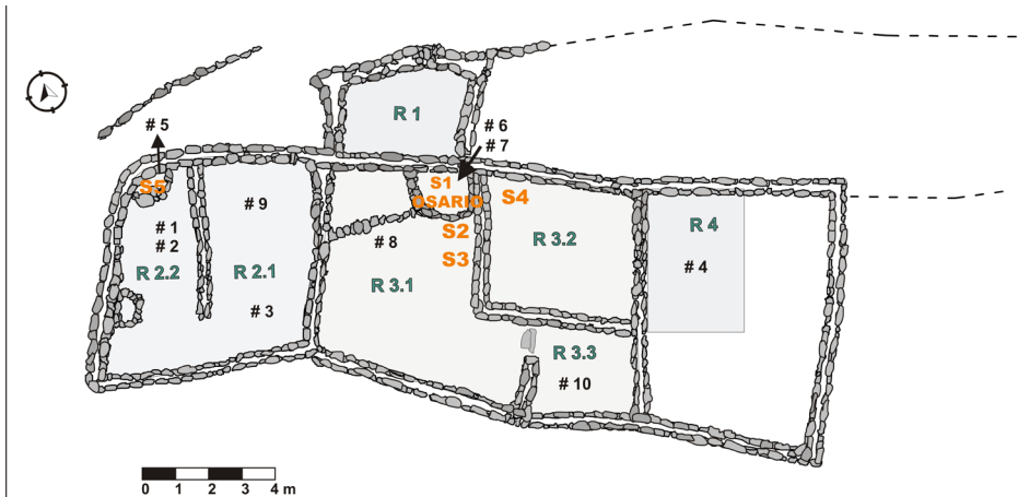
Figura 2. Planta de la Unidad Habitacional 1

Fuente: los autores, basados en Tarragó (1992), y modificada por el arquitecto Joaquín Trillo. Ubicación de los fechados presentados en la tabla 1, correspondientes a las dataciones de los pisos de ocupación y las sepulturas. Las siglas S1, S2, S3, S4 y S5 refieren a las sepulturas detectadas durante las diferentes etapas de excavación de esta Unidad.