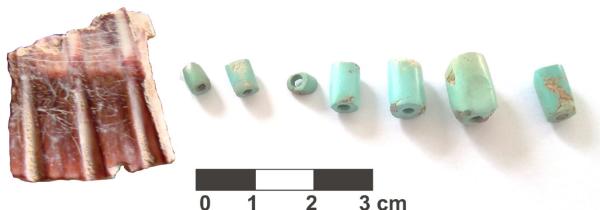
Figura 6. Hallazgos dispersos extracámara. Cuentas de turquesa y un trozo de valva de Pecten purpuratus Lam

Entre los objetos que corresponden a este último evento de dispersión extracámara de restos humanos e inclusiones culturales –todos los cuales se encontraron a su vez integrando la matriz superior del relleno del patio– se pueden mencionar siete cuentas de turquesa, un fragmento de valva de Pecten purpuratus Lam. , numerosos fragmentos de calabaza –algunos pintados en rojo y negro–, trozos de madera, un vaso y una ollita de cerámica completos, y fragmentos de dos pucos (ver la figura 6).