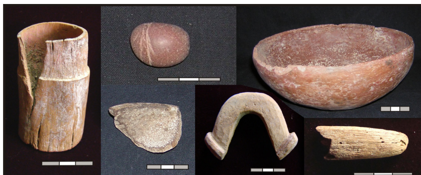
Figura 5. Materiales culturales del osario y la Sepultura 1. Arriba: cubilete de madera con restos de pigmento rojo en su interior, pulidor síliceo y puco estilo Rojo Pulido. Abajo: fragmento de calabaza seccionada, tarabita de hueso y fragmento de varilla de madera

nes de pintura roja (ver la figura 5). Los restos óseos se encontraron cubiertos por una delgada capa de cenizas. Durante la extracción, aunque no fehacientemente asociados con este rasgo, se recuperaron además un pulidor síliceo con ranuras, posiblemente utilizado como colgante, dos pucos de cerámica y panes de pigmentos (entre ellos limonita, yeso y un polvo gris verdoso con contenido de cobre) (figura 5).