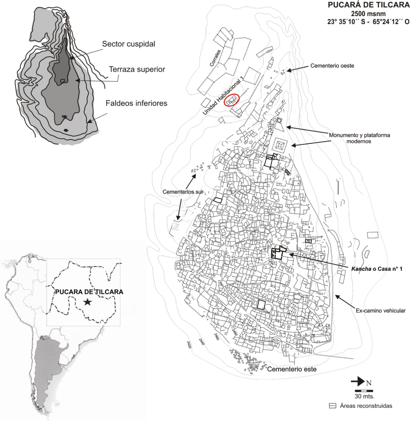
Figura 1. Plano del Pucará de Tilcara y trazado del sitio con referencias espaciales