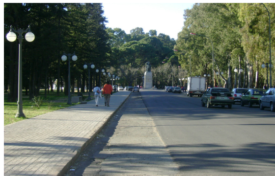
Imagen 6. La Avenida de las Sophoras luego de la implementación del proyecto de intervención urbana. Fotografía tomada por Emilce Heredia Chaz, junio de 2007.

C ontinuando con nuestro recorrido, al llegar a la esquina de Alem y Córdoba, nos topamos con el portal de acceso al Parque de Mayo, el cual se impone sobre el espacio apelando a ser percibido. La intervención sobre el portal, a través de las tareas