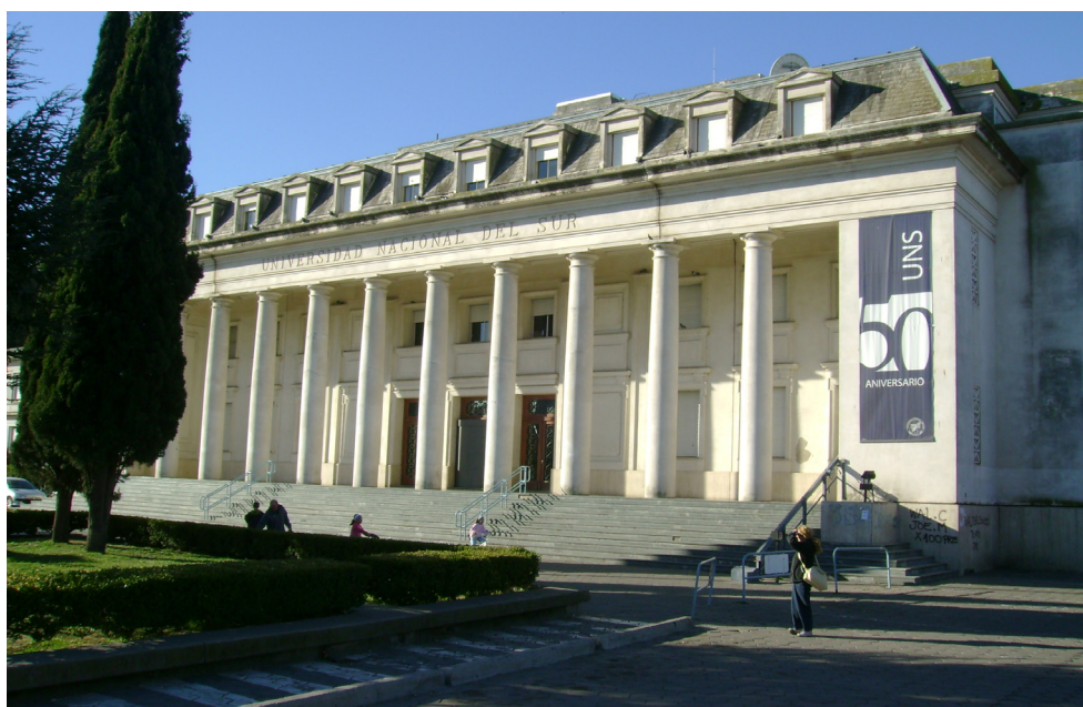
Imagen 4. Edificio central de la Universidad Nacional del Sur. junio de 2007.

E l cuerpo que recuerda. A través del recorrido trazado por cada uno de los elementos que conforman el área afectada por el proyecto de intervención urbana del gobierno de Cristian Breitenstein, resulta posible rastrear una común conexión entre todos ellos. En el trazado de la Avenida de las Sophoras, en el Monumento a los Fundadores, en el portal de ingreso al Parque de Mayo y en el edificio central de la Universidad Nacional del Sur se encuentran presentes, de diversos modos, representaciones ca-