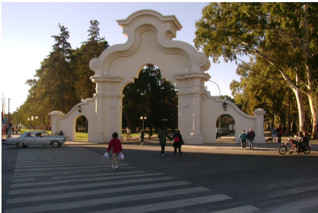
Imagen 3. Portal de ingreso al Parque de Mayo. Fotografía tomada por Emilce Heredia Chaz, junio de 2007.

Nacional, 16 fue quien diseñó esta obra de estilo neocolonial (Cabré Moré, 1978).