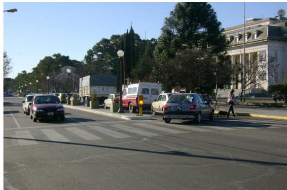
Imagen 5. Esquina de Avenida Alem y San Juan desde donde se puede observar el bulevar. Fotografía tomada por Emilce Heredia Chaz, junio de 2007.

A continuación, nos proponemos dar cuenta del modo en que dicho espacio urbano sirve como soporte para el desarrollo de un recorrido corporal que apunta a la internalización de una determinada representación vinculada con el poder. Este recorrido cobra significado tanto si nos trasladamos a través de las sendas peatonales, como si nos movilizamos por medio de un vehículo. Sin embargo, le prestamos