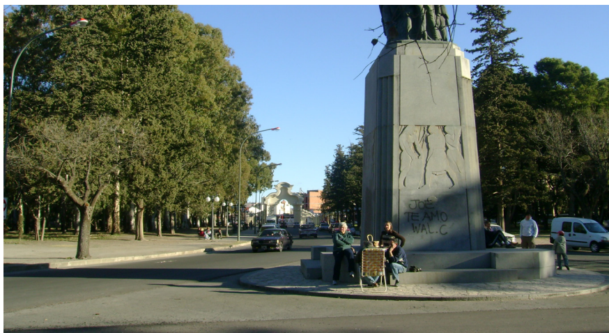
Imagen 7. El Monumento a los Fundadores y el portal del Parque de Mayo unidos por la Avenida de las Sophoras. Fotografía tomada por Emilce Heredia Chaz, junio de 2007.

E l poder político procura imponer una representación de sí mismo haciendo uso del soporte urbano como un medio para engendrar prácticas que se internalizan con el recorrido hecho con el cuerpo. Con la lentificación de la velocidad del tránsito vehicular sobre la Avenida Alem, con el paso por debajo del arco del Parque de Mayo y con la circulación por la Avenida de las Sophoras en sentido unidireccional - todo esto reforzado con una fuerte iluminación -, se produce una vivencia corporal que apunta a la producción de un determinado esquema mental. De este modo, las imágenes internas y externas entran en interacción y, como postula Hans Belting, "es nuestro propio cuerpo el que nos sirve como medio [de soporte] viviente" (2005, p. 306).