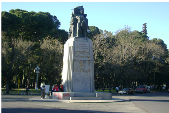
Imagen 2. Monumento a los Fundadores.

extranjeras fue la contrapartida de dos iniciativas promovidas por argentinos, que se concretaron únicamente mediante la colocación de piedras fundacionales” (2011, p. 270). Una de estas iniciativas fue impulsada por quienes se presentaban como los descendientes directos de los primeros habitantes, proponiendo la erección de un Monumento a los Fundadores, el cual fue finalmente inaugurado el 11 de abril de 1931 12