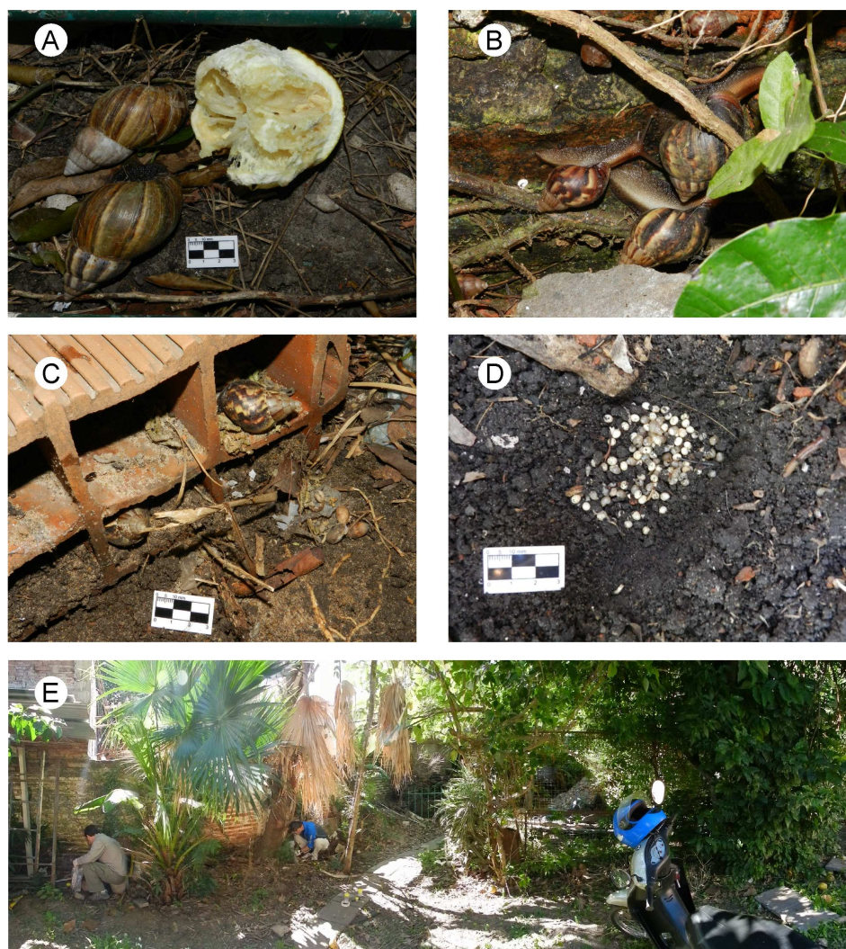
Figura 2. Ejemplares de Achatina fulica registrados en la localidad de Corrientes (Argentina). A: Alimentándose de cítricos; B: Sobre una pared húmeda, en actividad diurna; C: Refugiados en ladrillos huecos; D: Una ovada en la parcela 1 (húmeda); E: Foto panorámica (180°) mostrando el sitio de muestreo.

para el sur de Sudamérica (Vogler et al. , 2013), este hallazgo se ubica precisamente dentro de una de las áreas de mayor susceptibilidad a ser invadida por el caracol gigante africano (zona argentina limítrofe a los ríos Paraná y Paraguay). Sobre la base de la evidente dispersión de esta agresiva especie invasora y la información de riesgo de invasión con la que se cuenta (Vogler et al. , 2013), validada en parte a partir de este nuevo registro, se enfatiza la necesidad de que los organismos de aplicación locales, regionales y nacionales, realicen el monitoreo y los controles pertinentes, sobre todo en zonas limítrofes, a los efectos de detener la expansión de esta especie invasora.