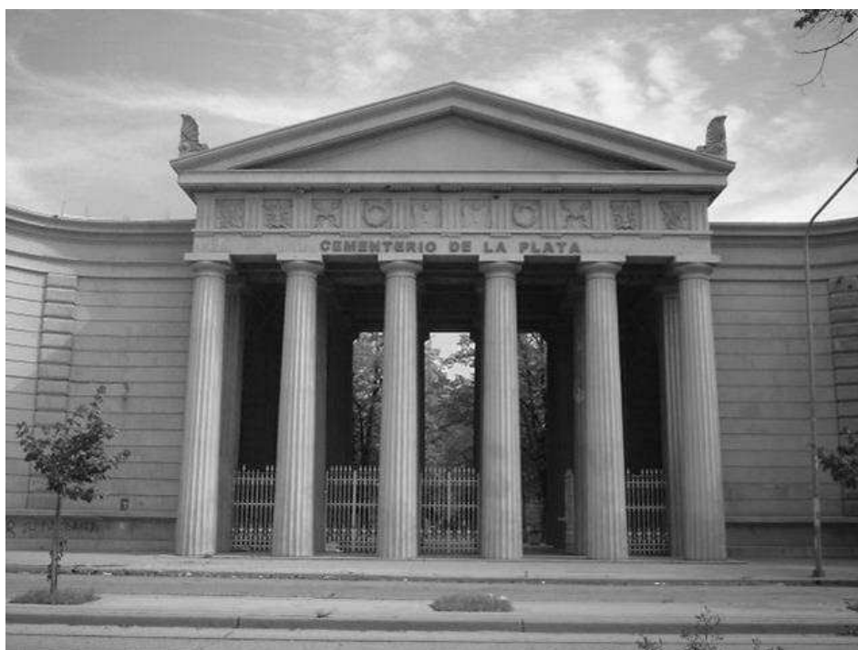
Figura 1. Entrada principal del cementerio de La Plata.

Su acceso principal fue concebido como la entrada a un templo griego con veinticuatro columnas dóricas (Figura 1), con sendas galerías laterales abovedadas conteniendo el sector de nichos, a las que se accede mediante escalinatas de mármol.