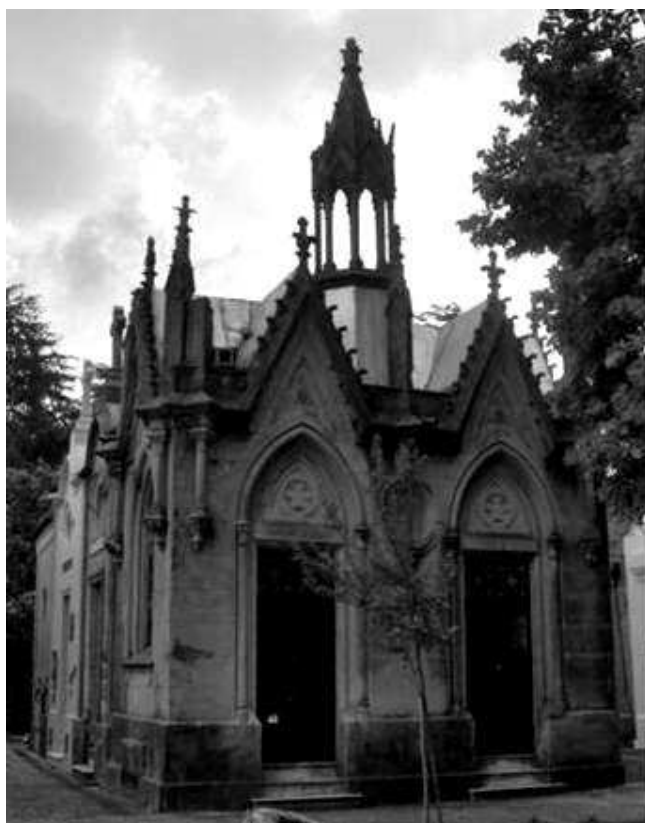
Figura 4. Sector D grandes panteones neogóticos.

Están caracterizados por fachadas y portales desarrollados sobre un zócalo de importante altura y a los que se accede mediante tres escalones de mármol. Sus rasgos neogóticos son muy clásicos con una configuración bien estructurada y completa. Techo a dos aguas y transepto de cruce ortogonal con ventanas de arco apuntado u ojival usado también en las puertas. Imposta