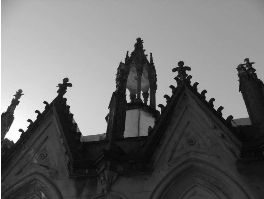
Figura 6. Gabletes rampados y linterna.