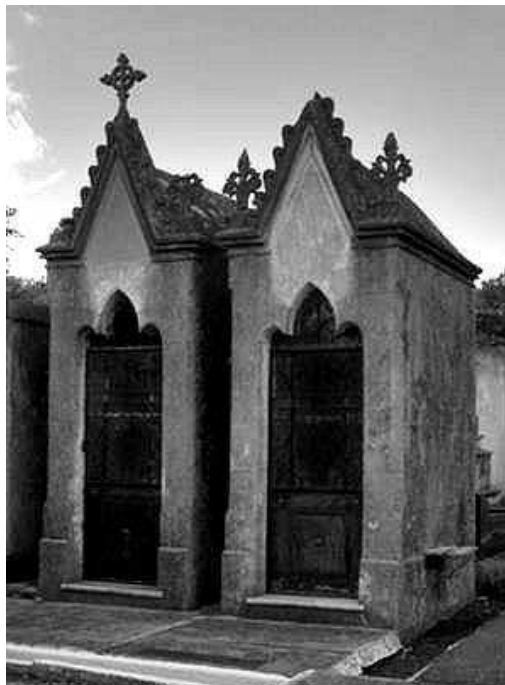
Figura 7. Pequeños panteones neogóticos