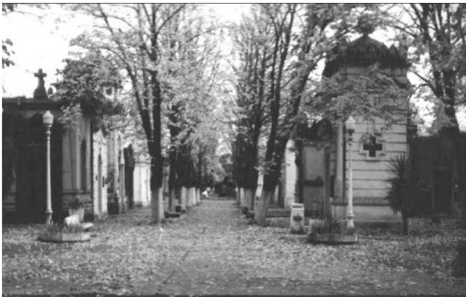
Figura 2. Avenida arbolada.

A continuación se desarrolla el predio de avenidas arboladas, plazoletas y jardines, con un sector de Panteones institucionales y familiares (bóvedas) en el que se encuentran expresiones importantes de los estilos arquitectónicos Neoclásico, Neogótico, Art Nouveau y Art Decó (Figura 2).