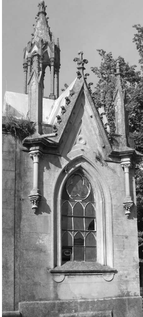
Figura 5. Ventana ojival.

seleccionaron dos bóvedas contiguas, de pequeño tamaño (Figura 7). Por ocupar dos lotes pequeños de 1,50 m por 2 m, carecen de cripta. Los profesionales actuantes fueron constructores habilitados, pero sin título.