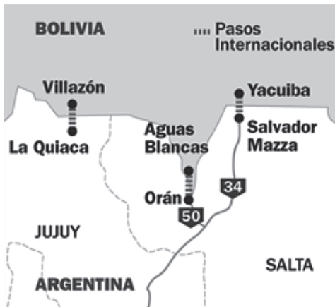
Figura 3. Fronteras por las que ingresa la cocaína

La droga ingresa a nuestro país por el norte y se mueve hacia el sur, por vía terrestre, fluvial o aérea: desde los paseros que contrabandean distintas mercancías –incluidas drogas– cruzando la frontera a pie por el cauce del río seco o a través de la selva –de forma tal de evitar los controles de la gendarmería–, hasta las avionetas que utilizan pistas ilegales o dejan caer del cielo el cargamento en un predio de Jujuy, Tucumán, Santa Fe o Santiago del Estero, del que luego será recogido (la denominada lluvia blanca ) (Sampó, 2017).