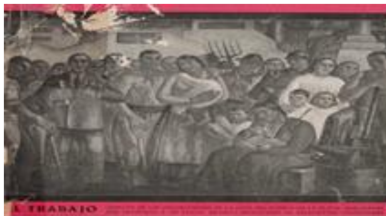
Ilustración n° 7: El Trabajo , pintura de Francisco de Santo.

El arte social vuelve a encontrar el antiguo aliento de vida en contacto con el pueblo en la decoración audaz de grandes ámbitos cerrados o abiertos, donde vibre la acción y el entusiasmo colectivos: Casas del Pueblo, Estadios, Bibliotecas, Teatros [...] Las pinturas de De Santo son una muestra de las posibilidades del arte en la sociedad del futuro que el Socialismo forja con esfuerzo heroico y perseverante. (Korn, 1935: n° 285)