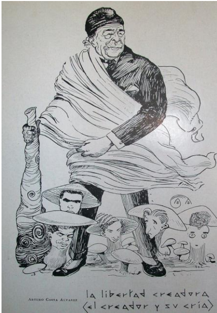
Ilustración n° 4: Alejandro Korn