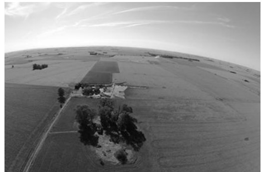
Figura 3. Foto aérea del sitio, donde se aprecian los dos grupos de construcciones, la del fondo es donde actualmente vive y trabaja la familia Gori.