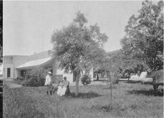
Figura 1b. Casa principal. Vista de finales del siglo XIX.