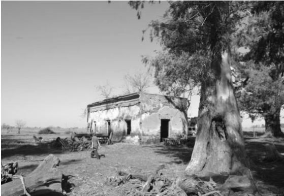
Figura 1a. Casa principal. Vista actual.

restos de otras construcciones o cimientos en distintos sectores del predio (antiguos galpones, corrales y caños de desagües) que aún no han sido relevados en detalle. La casa principal estuvo habitada hasta mediados de la década de 1980, por lo que podemos encontrar materiales de diversas épocas que manifiestan una continuidad ocupacional de la misma, hasta la actualidad (Giordano 2016; Hiba 2016). En algunas de las tareas realizadas en el sitio (tanto en excavación como en recolección superficial en la zona que actualmente se encuentra con cultivos) surgieron numerosos fragmentos de loza, vidrio y de gres. En este informe nos detendremos en análisis preliminares acerca de estos materiales.