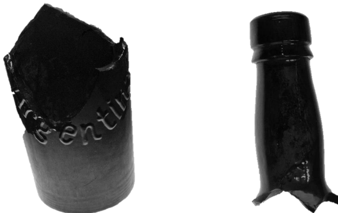
Figura 7. A. Fragmento de botella hallado en el sitio; B. Pico de botella.