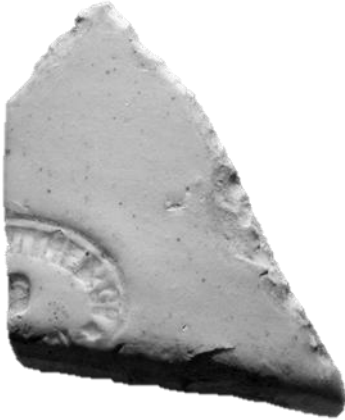
Figura 4. Fragmento hallado en Hughes, fabricado por Macintyre & Co. Liverpool, Inglaterra.

De los numerosos fragmentos de gres hallados en Hughes (aún hay material en proceso de análisis), solo dos poseían los sellos de las fábricas donde fueron realizadas. Uno corresponde a una de las principales fábricas de envases de la ciudad de Liverpool, denominada Macintyre & Co. (Figura 4). También se halló otro, de la marca Kennedy proveniente de Glasgow, Escocia (Figura 5). Estas marcas se importaron desde los años 1860 - 1880 (Schávelzon 1987, 2010).