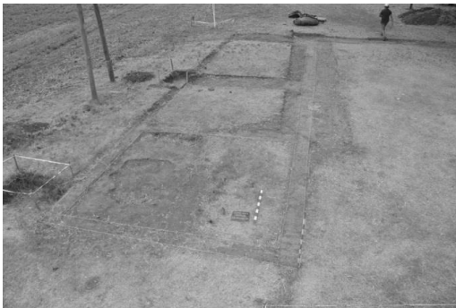
Figura 2. Cimientos de habitaciones vecinas a la construcción principal.