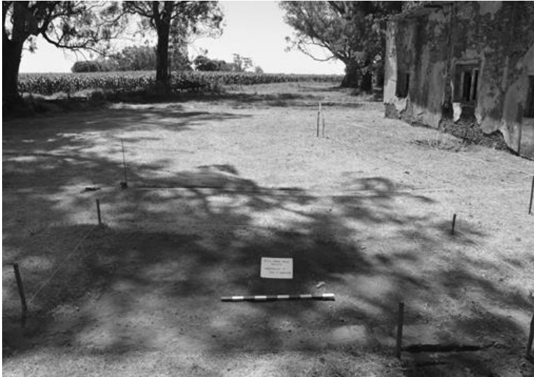
Figura 6. Cimientos de la habitación excavada, donde se encuentran numerosas botellas.

Al avanzar los trabajos de excavación, se pudo conocer que la mayoría de las botellas se encontraban en el interior de la habitación, cercana a los muros y en gran cantidad. Es preciso mencionar que se trata de un primer trabajo exploratorio y que no se agotaron la totalidad de las unidades estratigráficas, por lo tanto es solo una aproximación parcial de lo hallado.