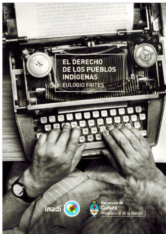
Imagen 2. Portada de El Derecho de los Pueblos Indígenas , recopilatorio de la obra de Frites.

A pesar de que el castellano se impuso desde la escuela, Frites entendía el "quichua", "idioma del Gran Tahuantisuyo" (Frites 2006). Su conocimiento del "quichua santiagueño" estuvo influenciado por su esposa, doña Urbana Galván, quichua hablante oriunda de Figueroa, Santiago del Estero (Frites 2006: 266).[14]