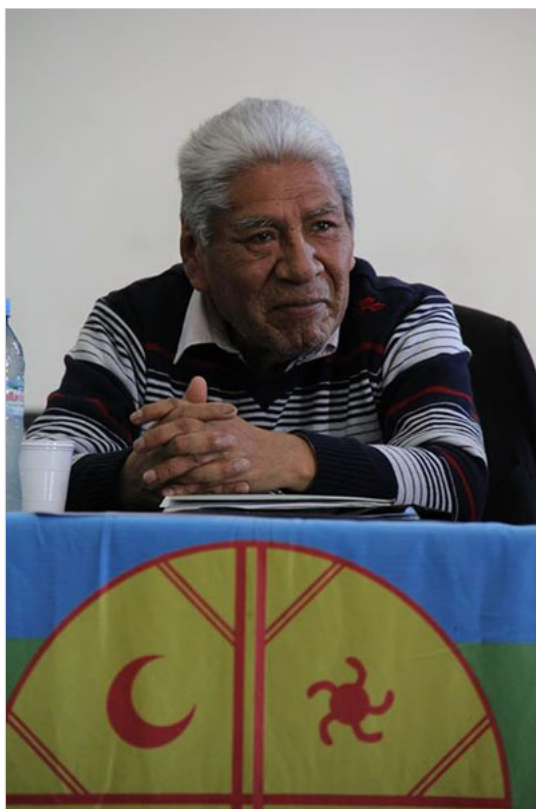
Imagen 3. http://argentina.indymedia.org/