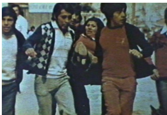
Heridos en Las banderas del amanecer (Grupo Ukamau, 1983)