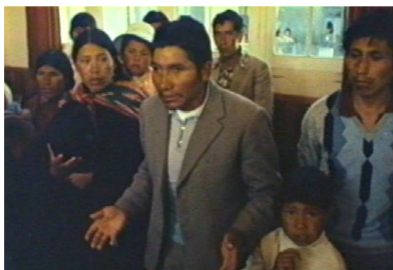
Un testigo en Las banderas del amanecer (Grupo Ukamau, 1983)

Como los hilos de un tejido artesanal, o la cuadrícula multicolor de la wiphala, la película se sostiene, halla su (en)carnadura en la convergencia de múltiples voces, cuerpos y puntos de vista: pero aunque diversa, la textura del discurso de Las banderas del amanecer no duplica la confusión que los traumáticos hechos del pasado reciente dejaron en su curso febril, sino que representa el intento de poner en sistema ese devenir. Es un documental de memorias en medio de los acontecimientos, memorias “que arden”, urgentes y urgidas por manifestarse, por “darse” –en el sentido de donación– en forma pública. La figuración del dolor y la presencia nodal del testimonio vuelven palpable, “táctil”, ese tejido de memorias en un film que constantemente se evidencia afectado por la proximidad de los hechos, las corporalidades, las miradas y las voces. Prima el registro directo, atravesado por la emoción: si falta la explicación reflexiva, el ordenamiento racional y preciso, es por su confianza en la eficacia emotiva y política de las figuraciones (del duelo y la acción) y audibilidades (testimonio) en tanto que antídotos que impiden la repetición 11 . Por eso, justamente, la película mira hacia el futuro, hacia un nuevo amanecer 12 .