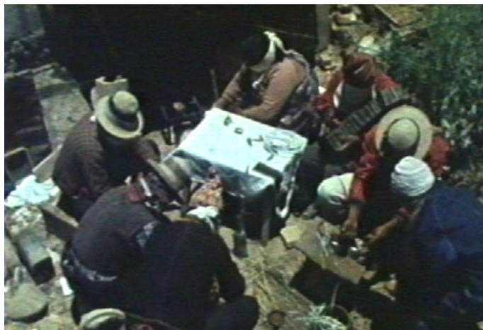
Escena final en Las banderas del amanecer (Grupo Ukamau, 1983)