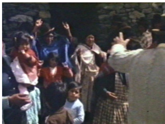
Recreación en Las banderas del amanecer (Grupo Ukamau, 1983)