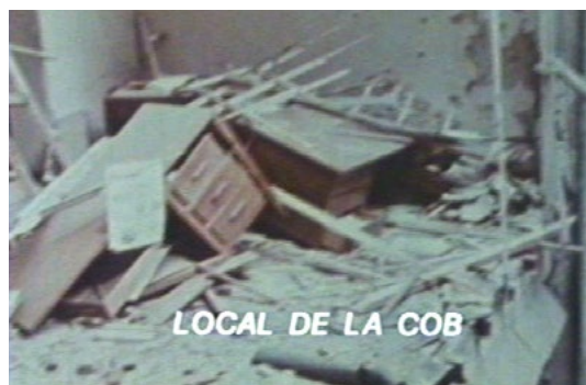
Local de la Central Obrera Boliviana (COB) en Las banderas del amanecer (Grupo Ukamau, 1983)