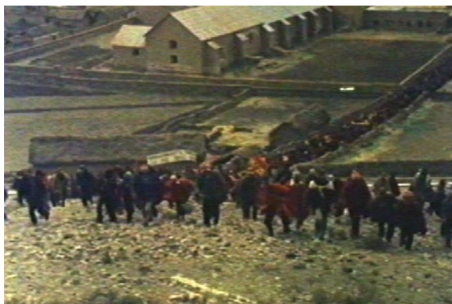
Patio en armas en Las banderas del amanecer (Grupo Ukamau, 1983)

cer? ¿La persistencia de lo ausente-ausentado que reclama su sitio? ¿Residuos o semillas de memoria(s)? La película funciona como una experiencia visual atenta y sensible a parcelas de humanidad que en su supervivencia –porque resisten los embates de destrucción y destitución de su condición humana–, buscan hacerse ver y oír –supervivencias. Para tejerse como wiphala de memoria(s) gracias a la cual se recuerda la violencia que desfigura los cuerpos y la solidaridad que les restituye su condición humana; el film recoge las voces del coro, privilegia un fresco diverso y