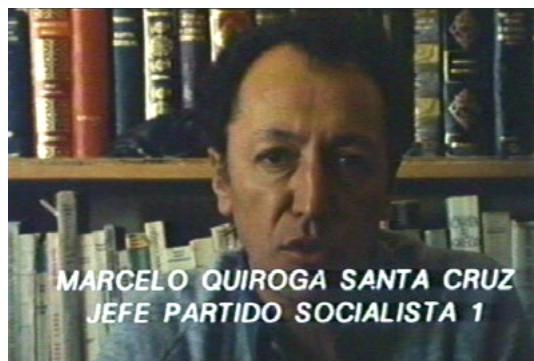
Marcelo Quiroga Santa Cruz en Las banderas del amanecer (Grupo Ukamau, 1983)