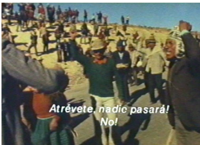
Un bloqueo en Las banderas del amanecer (Grupo Ukamau, 1983)