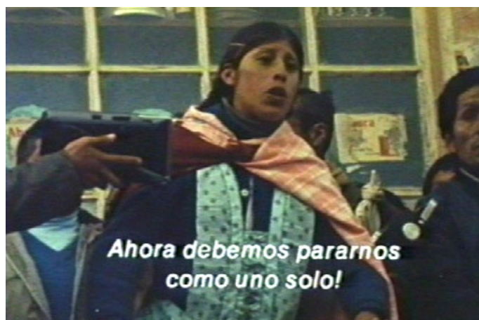
Una oradora en Las banderas del amanecer (Grupo Ukamau, 1983)

la voz over expositiva, dispone escalas disímiles (singular, grupal y colectivo) y texturas plurales (ruidos, músicas andinas, el rugir del viento); voces con diversas inflexiones y especificidades lingüísticas; susurros, gritos, llantos, cantos y arengas 17 . Al fin y al cabo: ¿no se trata, pues, de la puesta en diálogo entre distintas sobrevivencias corporales que hallan en la imagen una supervivencia que condensa su punto de encuentro-escucha? En efecto, tal como nos ha enseñado Georges Didi-Hubermann,