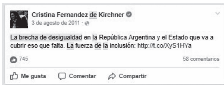
Captura 1. Facebook. 3 de agosto de 2011.