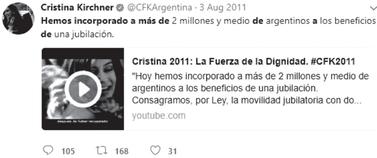
Captura 3. Twitter. 3 de agosto de 2011.

Se genera una transposición de la voz en off del video 11 y además se adiciona el hipervínculo, generando un efecto de redundancia. El enlace al video de YouTube funciona como una descripción-expansión de una argumentación (Hamon, 1994). Por consiguiente, si bien se trata de citas directas de los discursos de Fernández de Kirchner en los spots , en la serie de tuits y en las publicaciones de Facebook se construyen como microentimemas y microejemplos en los cuales los videos funcionan como prueba de la argumentación. En otras palabras, son microargumentaciones multimediáticas .