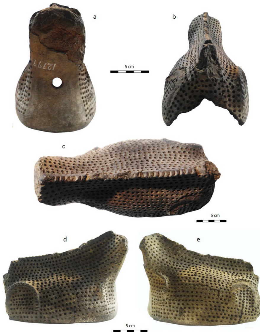
Figura 3. Campana n° 2: a-e) distintas vistas de la pieza.

ha sido identificada como un ñacurutú ( Bubo virginianus ). De hecho, el cuerpo del animal presenta las características de un ave, puesto que se ha modelado las alas y el plumaje caudal (Tabla 1). Sin embargo, los rasgos de la cabeza parecen corresponderse más con un mamífero que con un ave strigiforme. Como se muestra en la Figura 4, se observan pequeñas protuberancias modeladas sobre su cabeza, las cuales, siguiendo la identificación tradicional, podrían haber sido consideradas como los penachos que recubren los oídos en esta especie de búho. No obstante, cabe la posibilidad que se haya buscado diseñar orejas, es decir, el pabellón auricular de los mamíferos. Por