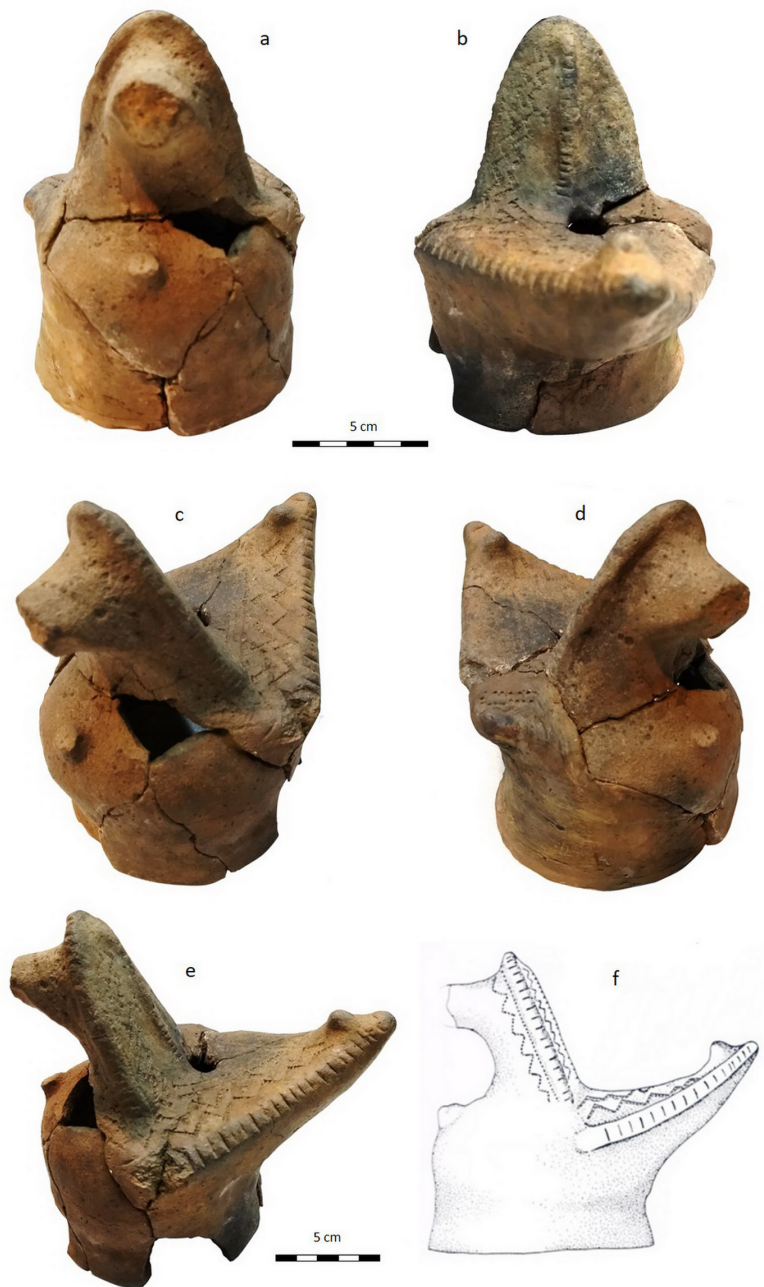
Figura 2. Campana n° 1: a-e) distintas vistas de la pieza, f) esquema del perfil izquierdo, tomado de Hilbert (1991).

Posee una altura de 15,8 cm. Su cuerpo es básicamente ovoide con un orificio basal de 21 cm de diámetro máximo y de 11,1 cm de diámetro mínimo. Se observa un orificio frontal de 1,1 cm. No presenta orificio superior. El espesor de pared es de 1 cm. La determinación taxonómica del animal representado se encuentra limitada por la fractura