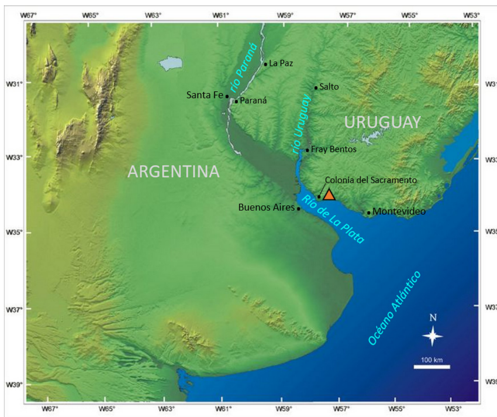
Figura 1. Localización aproximada de hallazgo de las piezas.

En esta oportunidad, se presentan los resultados del relevamiento y análisis de atributos morfológicos y estilísticos realizados en tres piezas cerámicas conocidas tradicionalmente como campanas, procedentes de las costas del Río de La Plata (Departamento Colonia, Uruguay) (Figura 1). Las mismas se encuentran depositadas en el Museo Nacional de Antropología de la ciudad de Montevideo. Si bien han sido mencionadas