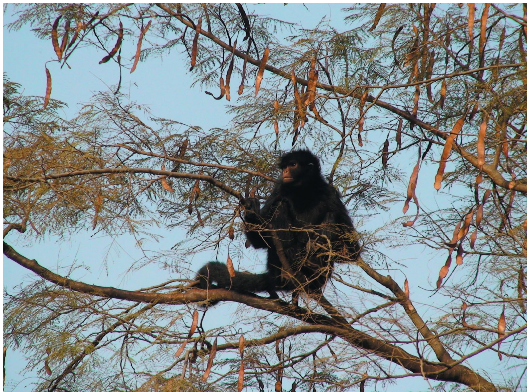
Figura 1. Mono araña negro hembra, Ateles paniscus , sentada en las ramas de un cebil colorado ( Anadenanthera colubrina ), en la pequeña isla de la Reserva Experimental Horco Molle, Tucumán.

1. Locomoción: el individuo se desplaza de un punto a otro en el espacio, usando miembros anteriores y posteriores o solo posteriores (cuadri o bipedalismo, respectivamente), rápido o lentamente, por el suelo o