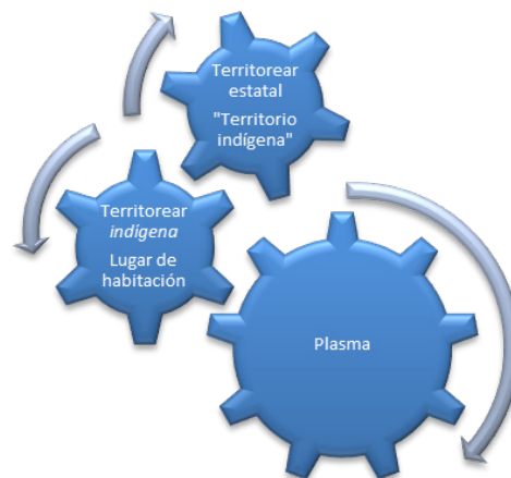
Cuadro 1. Transferencias de fuerza entre plasma, territoriar estatal y territoriar indígena

En este punto habría que diferenciar dos tipos de novedad. Por un lado, está la red de los seres, una línea de saltos que puede pensarse como un acontecimiento lateral en la medida en que se despliega en un mismo plano de inmanencia. Pero, por otro lado, está la aparición de fuerzas del plasma a pesar de los ensambles ya estructurados, produciendo en las redes un acontecimiento que llamamos diagonal ya que carga a los actores de una intensidad hasta entonces desconocida. No se trataría exactamente de la irrupción del acontecimiento radical que conceptúan los posestructuralismos sino de una torsión novedosa en las redes de humanos y no humanos 29 . En conclusión, planteamos que el conflicto onto-político entre diferentes modos de conjugar humanos y no humanos en los territorios estatal e indígena requiere rastrear tanto los reclutamientos y desencalajes de los actores disponibles en una red como las emergencias de actores novedosos en un acontecimiento lateral, así como también las fuerzas -ocuidas o liberadas- que se encuentran en una dimensión relativamente más “escondida” en las redes. El siguiente cuadro resume el esquema conceptual: