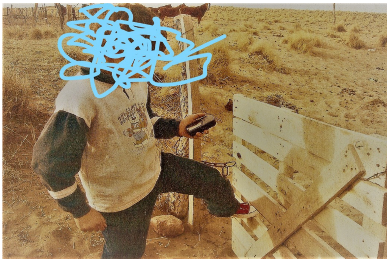
Figura 2: “gepeseando” el borde de la tranquera.