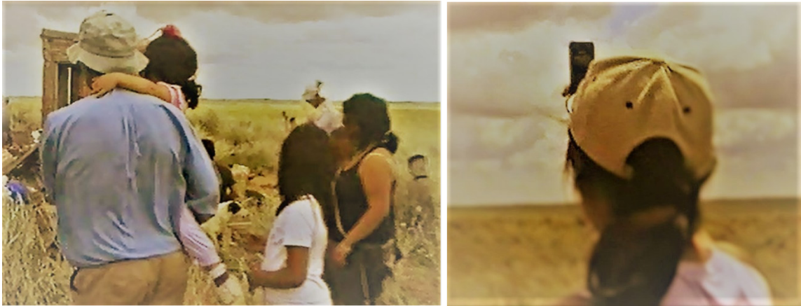
Figura 3a y 3b: Fotografiando el acontecimiento.