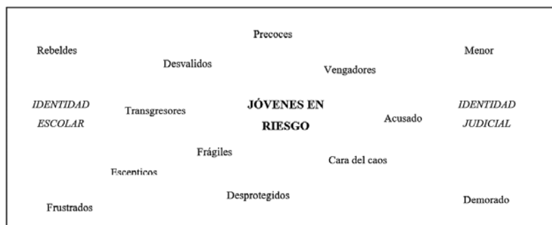
Diagrama 1 – Tipificación de las Juventudes en el Discurso Mediático