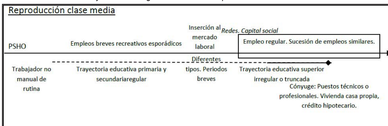
Figura 3. Trayectorias intergeneracionales de reproducción de clase media

“Yo no tenía ni... No sé qué tenía en los '90 [...] Me costaba, porque no podíamos juntar para la cuota, de repente. O si compraba una cosa, nos manteníamos al margen con otra. Entonces, teníamos que cubrir primero la alimentación de esta niña y la ropa. Entonces, teníamos lo necesario, un placarcito, su camita, unos cajoncitos, nada más, nada de lujos en esa época. Yo, por ejemplo, viví muy mal después de Cavallo 6 . Cavallo nos mató a todos. ¿Puedo hablar de eso?... A nosotros nos mató Cavallo, que decía que no iba a pasar nada [...] Y bueno, ahí fue muy duro, muy duro. Yo siempre digo: llegar adonde llegamos nosotros, que yo hice una casa, fue un sacrificio que solamente el hombro de uno se da cuenta con los años. Fue muy difícil [...], ahora en este gobierno el trabajador está más con los laureles puestos, más reconocido, más relajado” (Rosalía. Trayectoria de reproducción de clase trabajadora marginal).