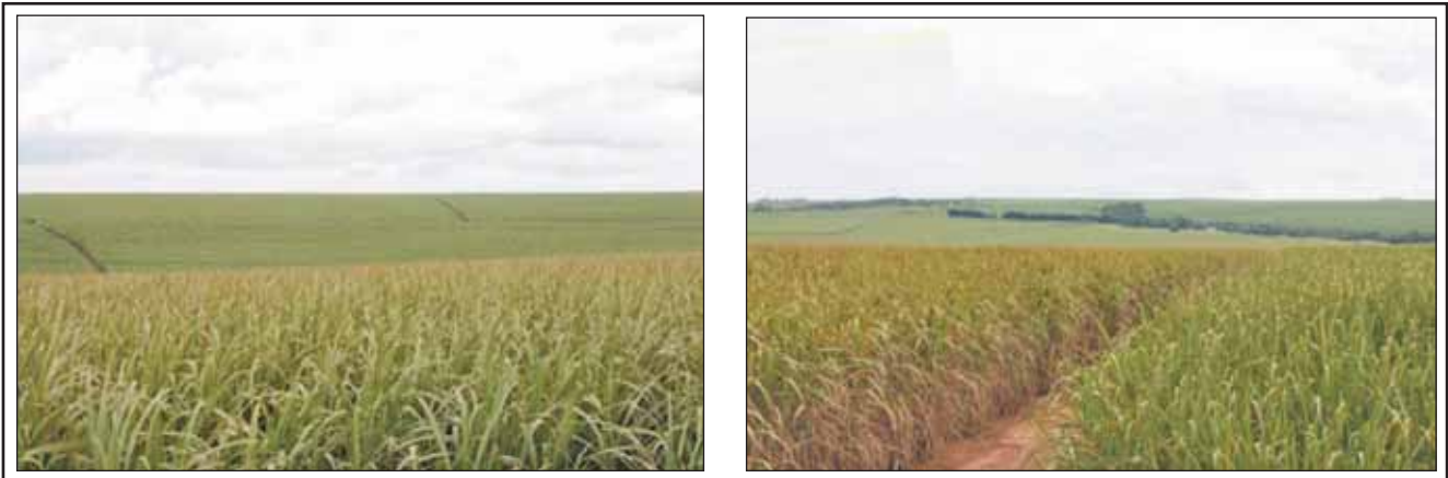
Figura 1. Lotes de caña con variedades susceptibles y resistentes a la roya naranja (San Pablo, Brasil).

En la Tabla 1 se observa que las variedades LCP85-384 y TUCCP77-42, utilizadas comercialmente