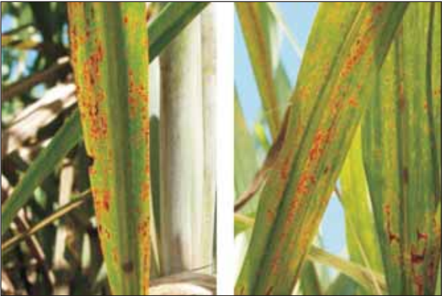
Figura 2. Síntomas de roya naranja en hojas.

Una herramienta para distinguir fehacientemente la roya naranja de la roya marrón es la observación bajo microscopio de la morfología de las esporas y de la presencia o no de paráfisis. En la Figura 3 se presentan fotos tomadas bajo microscopio