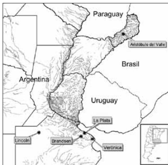
Figura 1. Ubicación geográfica del área de muestreo.

El estudio se llevó a cabo en niños con edades comprendidas entre 0 y 14 años de diferentes poblaciones de la provincia de Buenos Aires: partidos de La Plata (34° 55' S, 57° 56' O), Brandsen (35° 10' S, 58° 13' O), Verónica (35° 23' S, 57° 20' O) y Lincoln (34° 51' S, 61° 31' O), y de la provincia de Misiones: municipio de Aristóbulo del Valle, departamento de Caingúas (27° 08' S, 54° 54' O) (Figura 1).