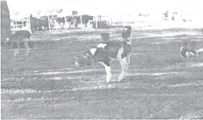
Fig. 1: Terneros bajo el sistema tradicional (ST) en la época fría.

Los terneros del ST se alojaron bajo una estructura pre-existente de media sombra de red 80%, orientada de E-O, con 18,0 m de largo, 4,0 m de ancho y 2,1 m de altura. La superficie disponible por animal fue de, aproximadamente 7,5 m 2 . La distancia entre las estacas impedía el contacto entre animales.