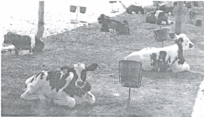
Fig. 3: Terneros bajo el sistema tradicional (ST) en la época cálida

El cortisol se cuantificó con un kit comercial ELISA (Salimetrics LLC, State College, PA, USA). En el mismo ensayo se prepara una curva de calibrado con concentraciones conocidas de estándares de