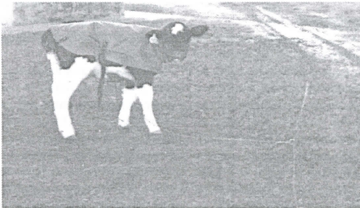
Fig. 2: Terneros bajo el sistema modificado (SM) en la época fría.