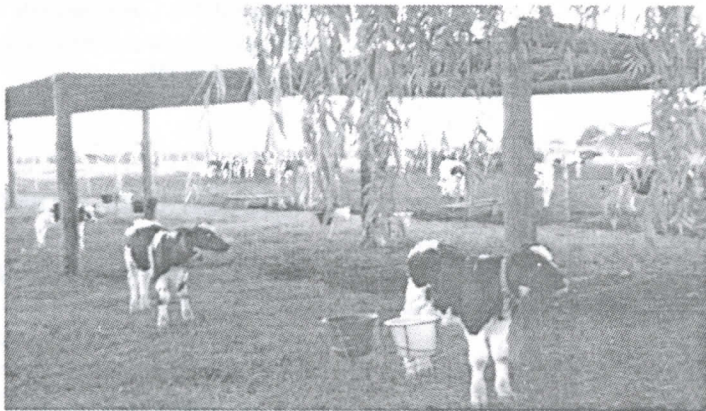
Fig. 4: Terneros bajo el sistema modificado (SM) en la época cálida