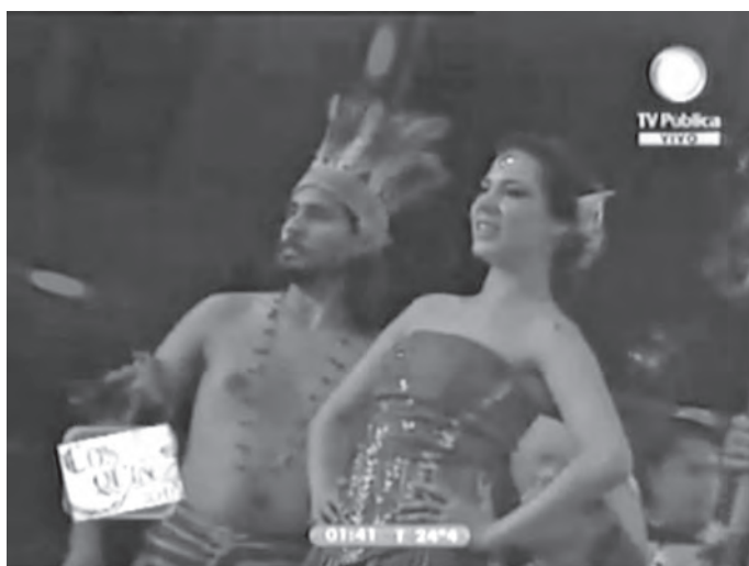
Foto 1. Pareja central de bailarines, Cosquín, 2011 < http://www.youtube.com/watch?v=Bvd9lbbkwBU >.

dancísticas chaqueñas, las cuales se caracterizan por pequeños pasos semisaltados (Ruiz y Citro, 2002; Citro y Cerletti, 2009).