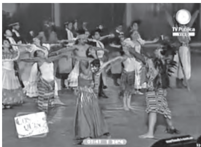
Foto 2. Bailarines en escena, Cosquín, 2011 < http://www.youtube.com/watch?v= Bvd9lbbkwBU >.

Ya en la cuarta estrofa, que se refería a la bebida y comida regionales compartidas –“Vino compañero, chipaco y chipa, soy de los que pueden también marginar”–, las parejas bailaban juntas. El segundo y final estribillo repetía la palabra “gualamba va”, término con el que se conoció a la región chaqueña en la época colonial, entonces los bailarines, levantando sus brazos, iban rodeando a aquel que representaba al indígena de la lanza y lo suben, mientras este último, con los brazos arriba, sostiene dos canastas con frutos. Desde la tercera estrofa y hasta este final, en la música se aprecia una creciente presencia melódica a través del sonido agudo del violín y la guitarra, así como de la variación de las voces. De este modo, la elevación de la altura de los sonidos y de los movi-