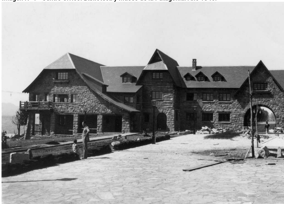
Imagen N° 1 - Centro Cívico: Biblioteca y Museo de la Patagonia. Año 1940.